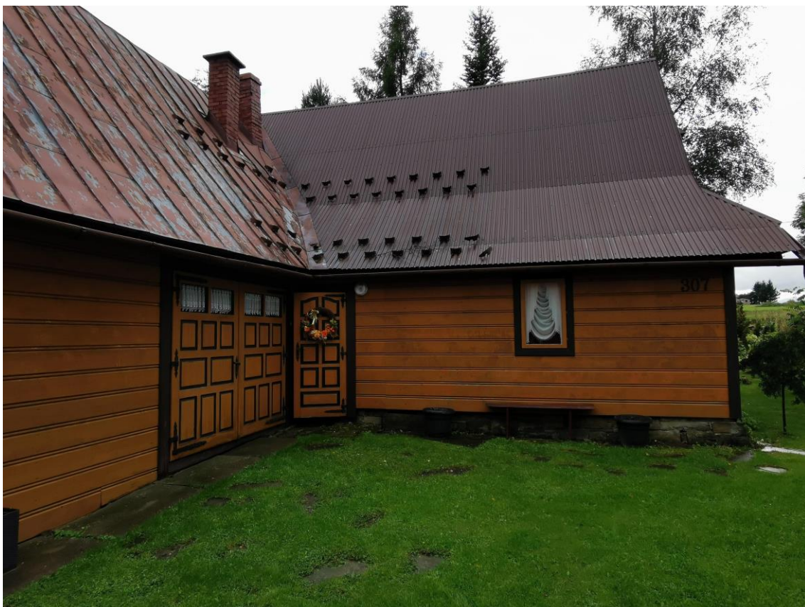
widok od strony N