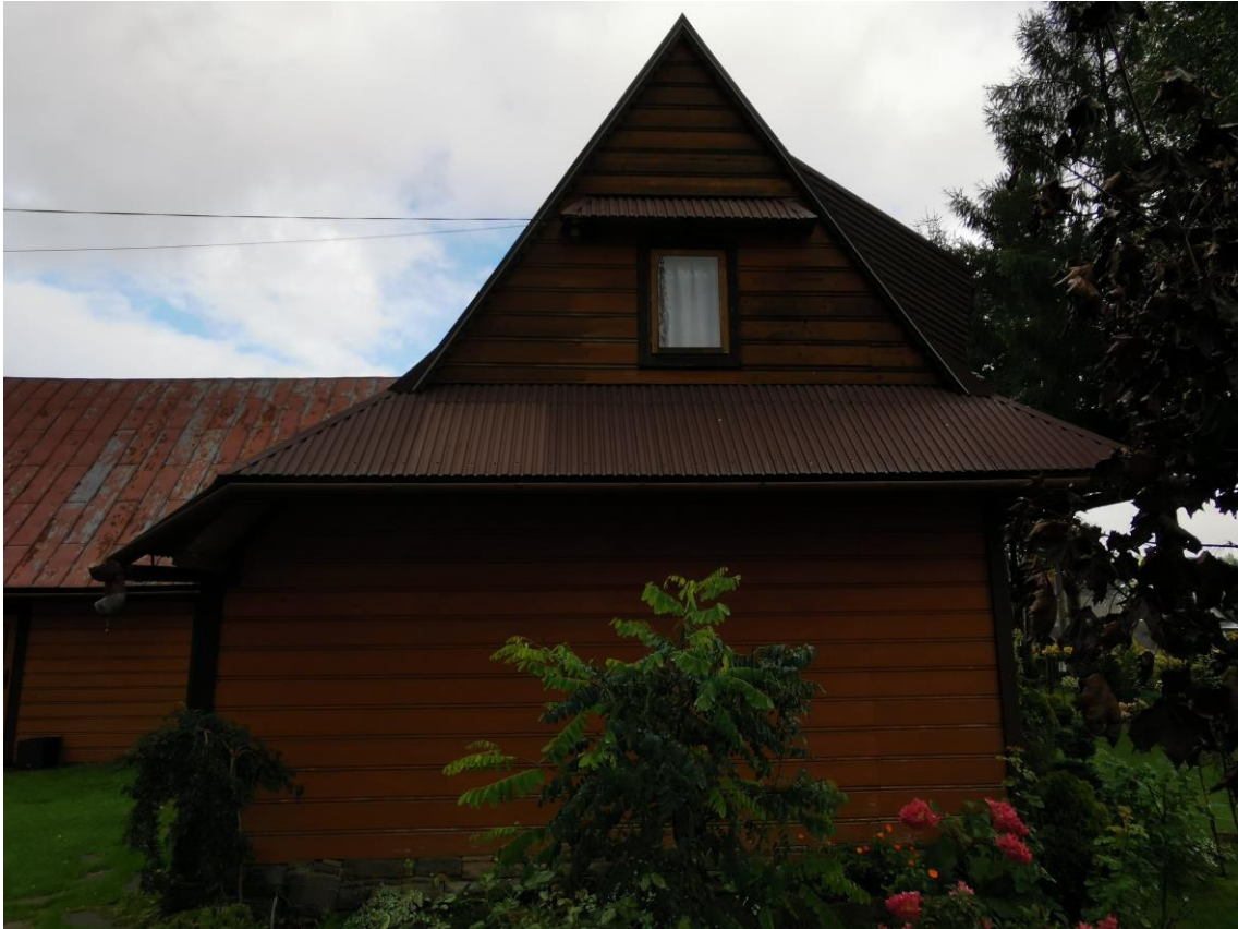
widok od strony W