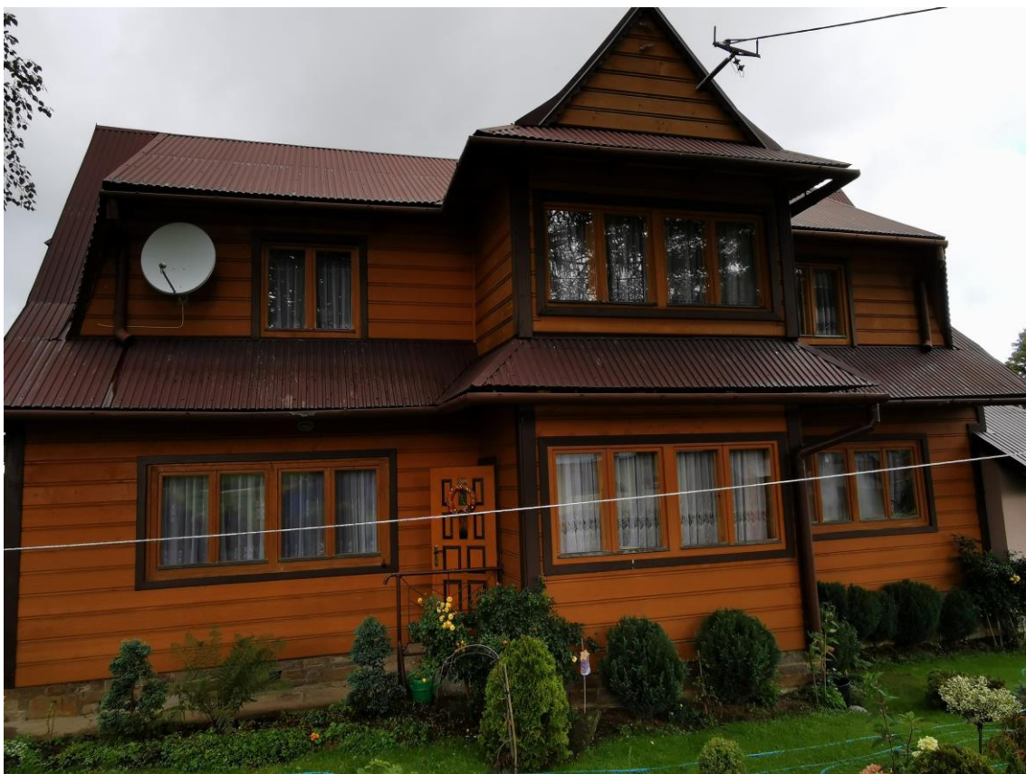
widok od strony S