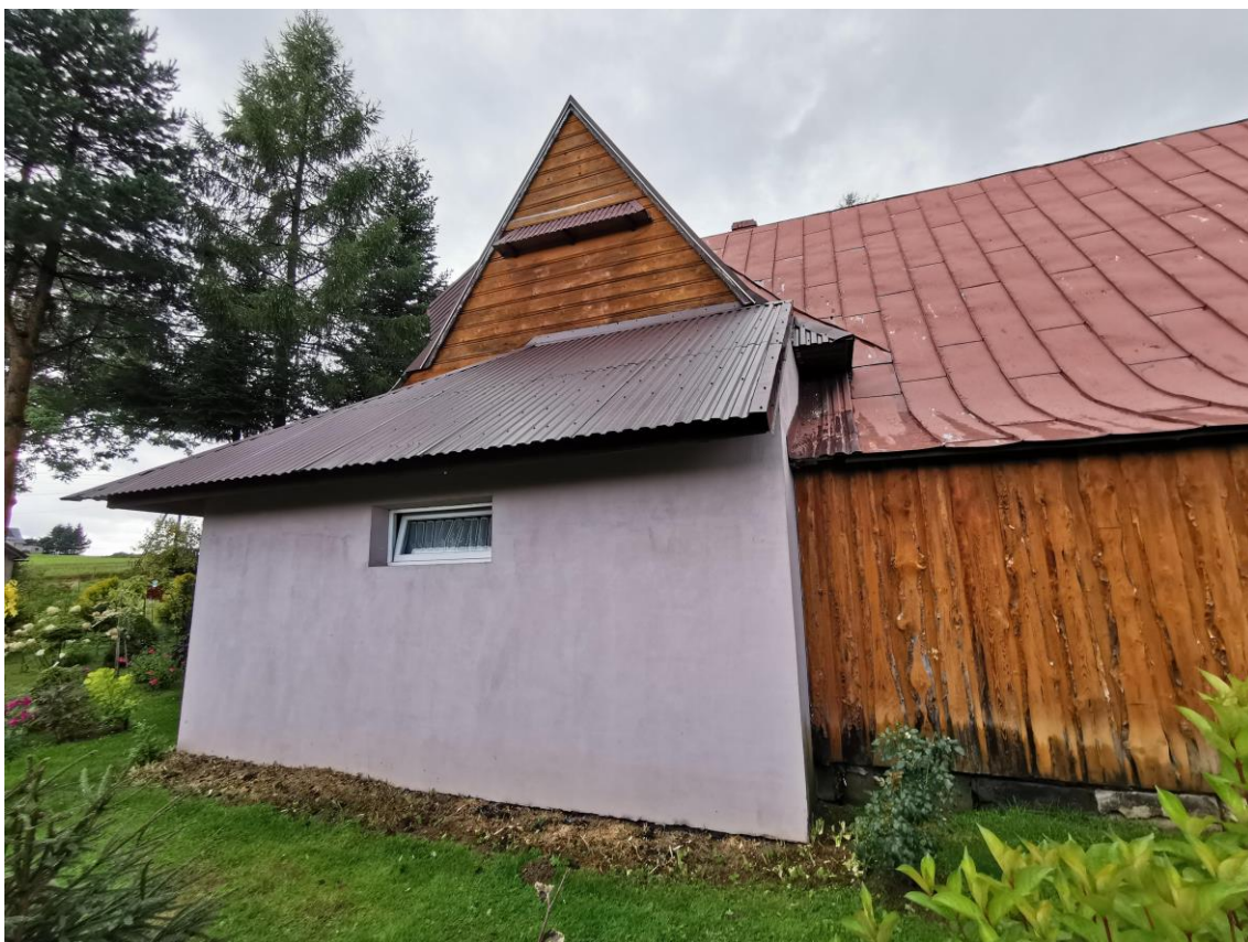
widok od strony E