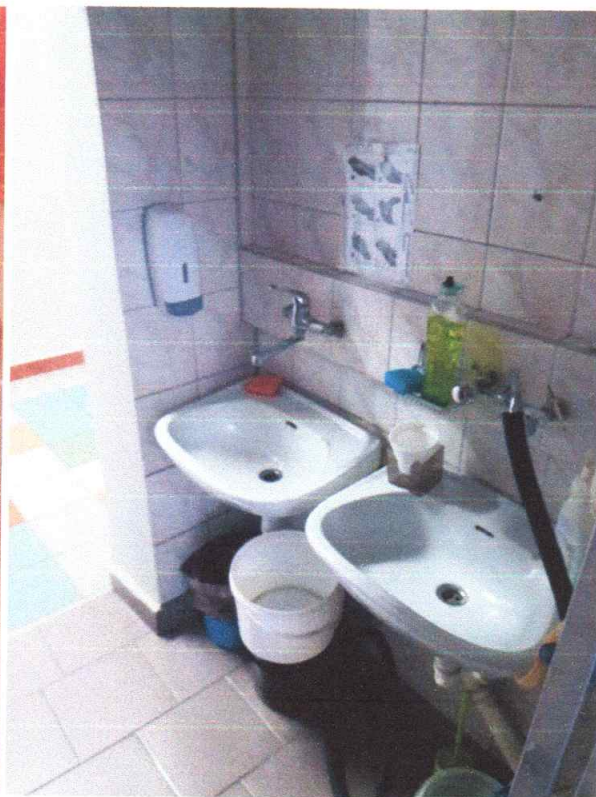
Zdjęcie 11. Widok na przedsiónek toalet