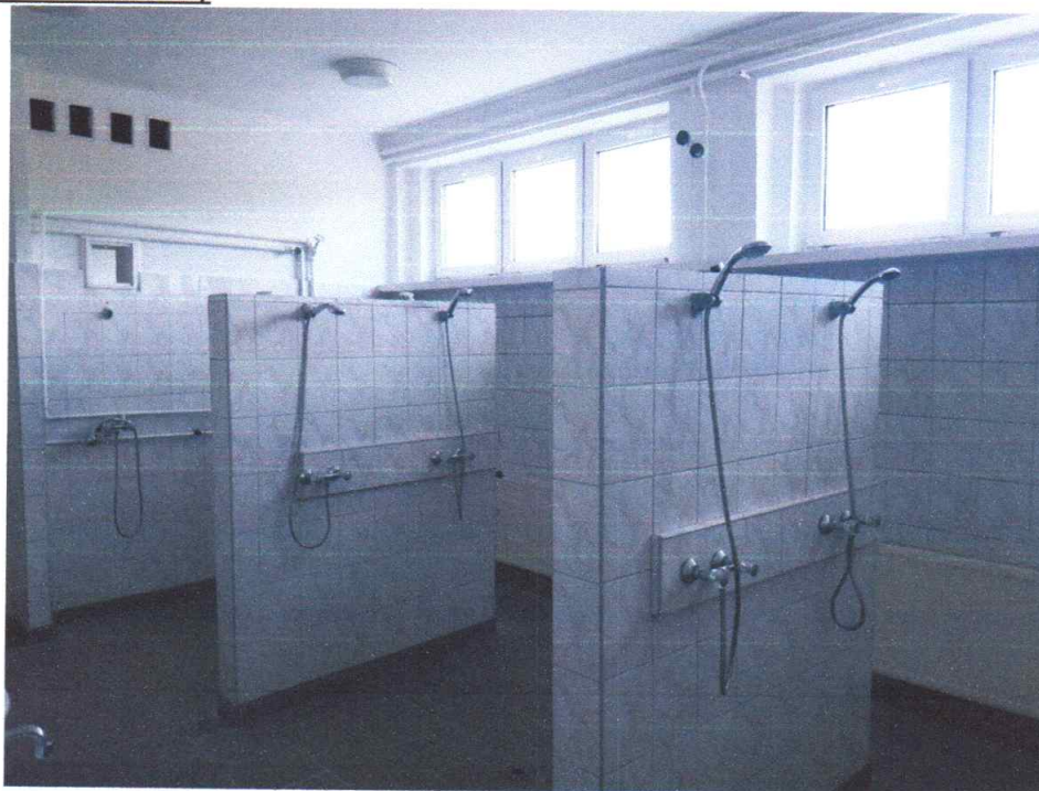
Zdjęcie 1. Widok na pomieszczenie natrysków