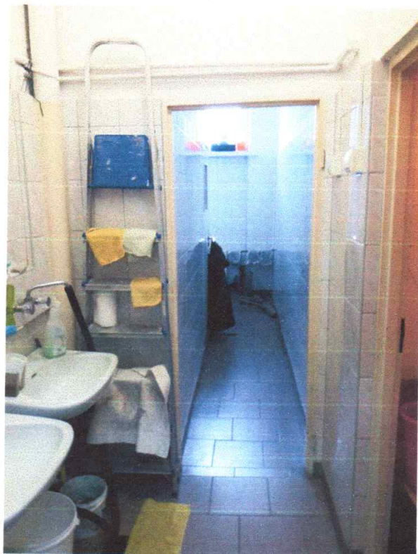
Zdjęcie 12, 13. Widok na przedsiónek komunikację i toalety