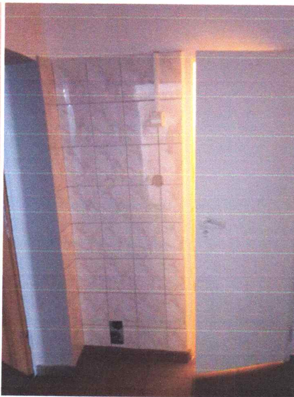
Zdjęcie 6,7 Widok na toaletę i przedsionek ( męski )