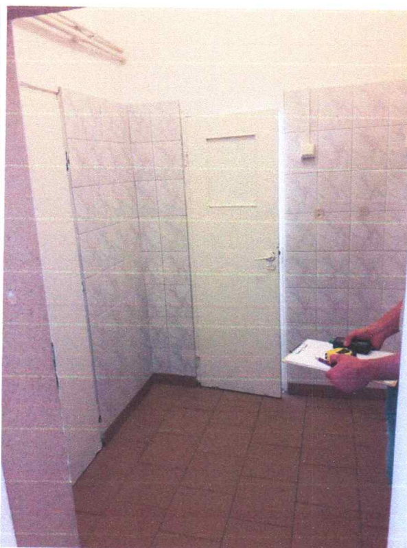
Zdjęcie 8,9 Widok na toaletę i przedsionek ( damski )