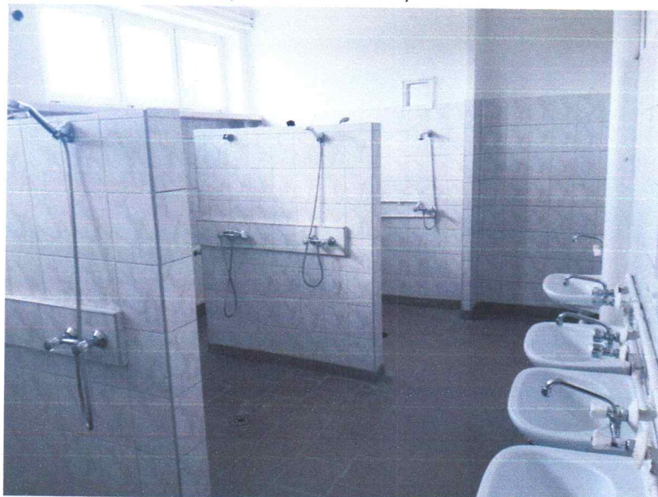
Zdjęcie 2 widok na pomieszczenie natrysków