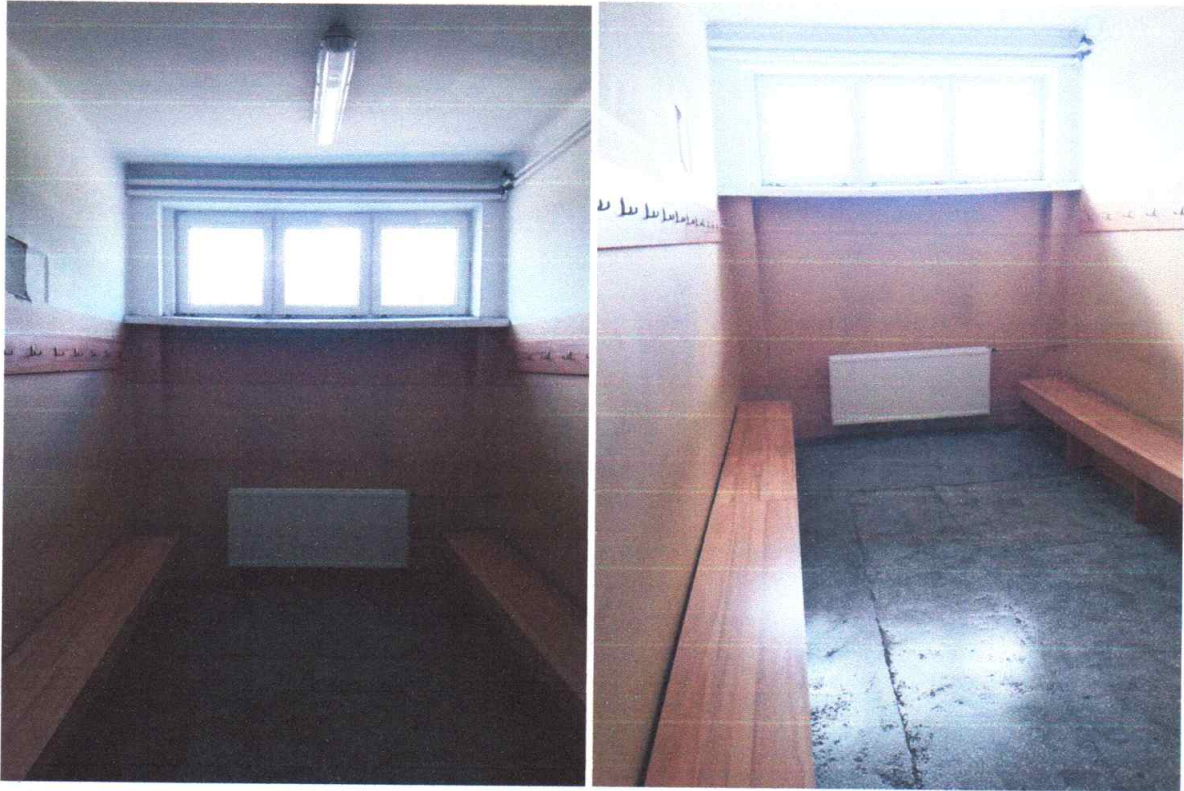
Zdjęcie 3,4 widok na pomieszczenia szatni