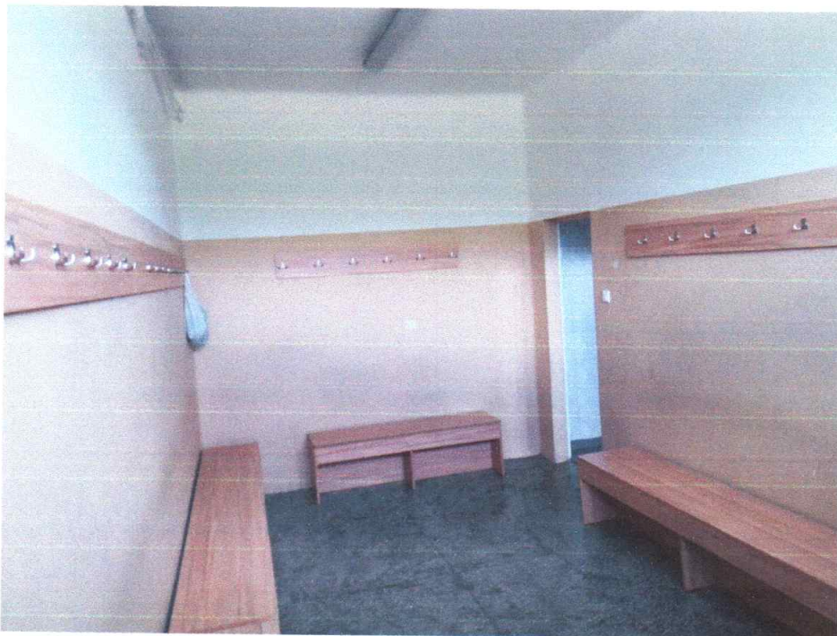
Zdjęcie 5. Widok na pomieszczenie szatni