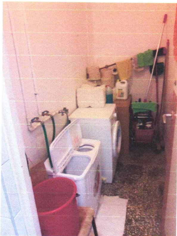
Zdjęcie 10. Widok na pralnię