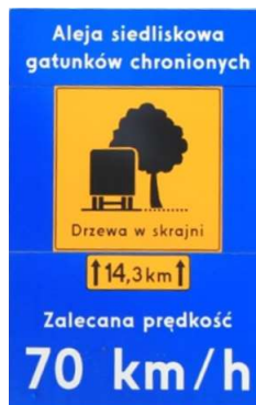
Rys. 2. Przykładowa tablica informacyjna o powodach zalecanej prędkości na drodze