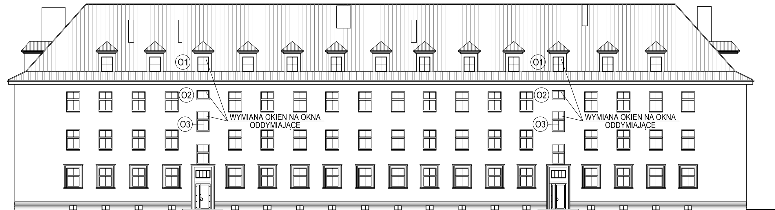
ELEWACJA WSCHODNIA - STAN PROJEKTOWANY 1:200 BUDYNEK "B"