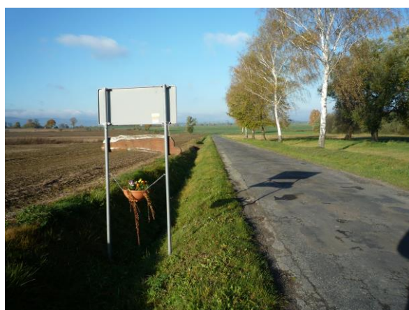
Zdj. nr 6 Środkowa część drogi