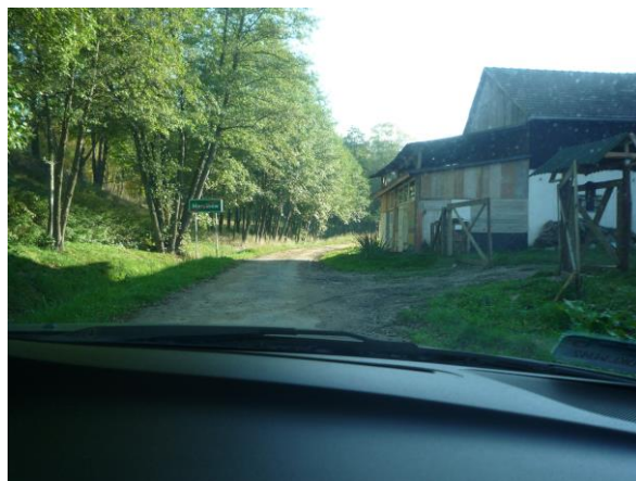
Zdj. nr 8 Koniec projektowanego odcinka Km 4+000