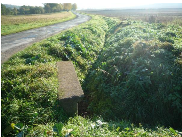
Zdj. nr 5 Istniejące rowy do odmulnienia