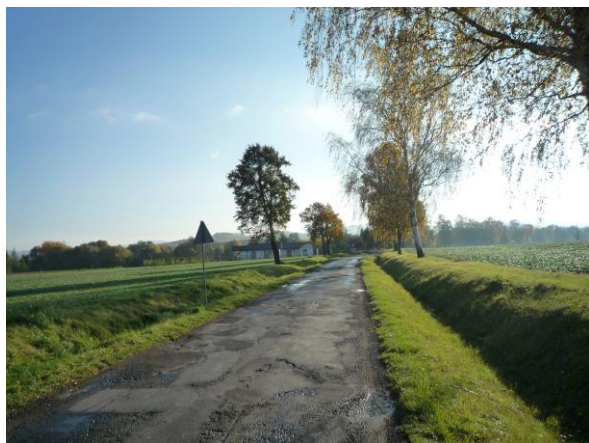
Zdj. nr 1 Km 0+000 Początek