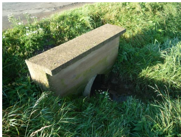
Zdj. nr 4 Przepust stan dobry