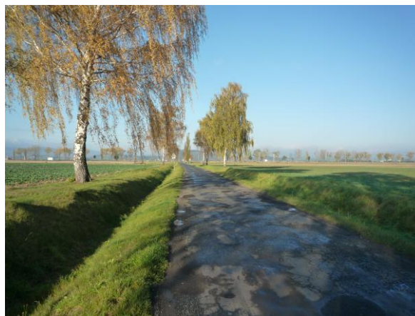
Zdj. nr 2 Początkowa część drogi