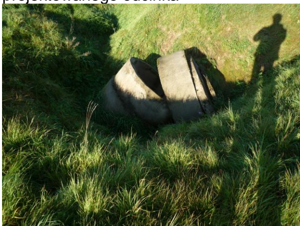
Zdj. nr 3 Studnia z rur do rozbiórki