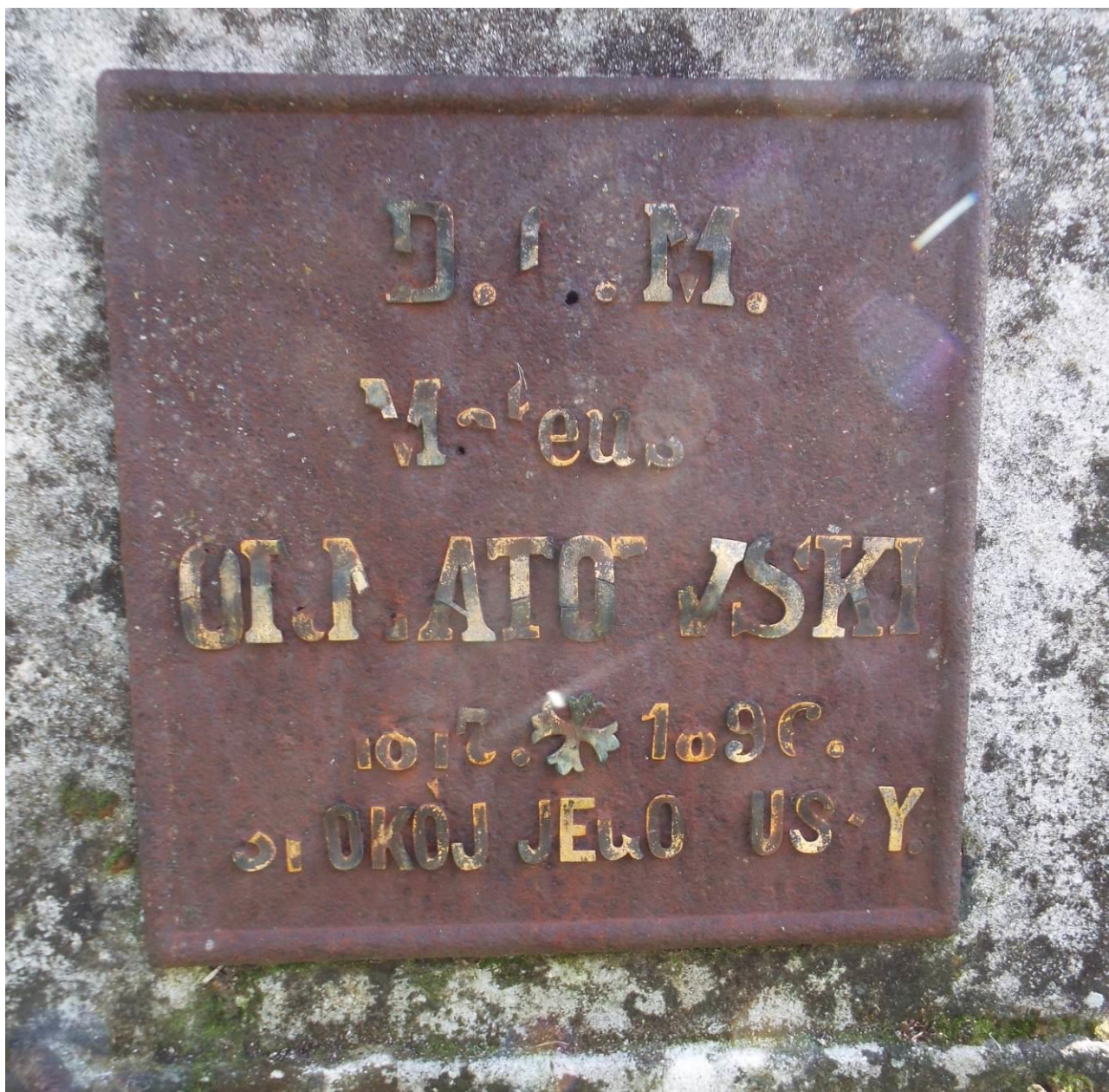
Stary Dzików, cmentarz komunalny, nagrobek Józefy Ornatowskiej i Mateusza Ornatowskiego, tablica z epitafium Mateusza Ornatowskiego, 2023 r.