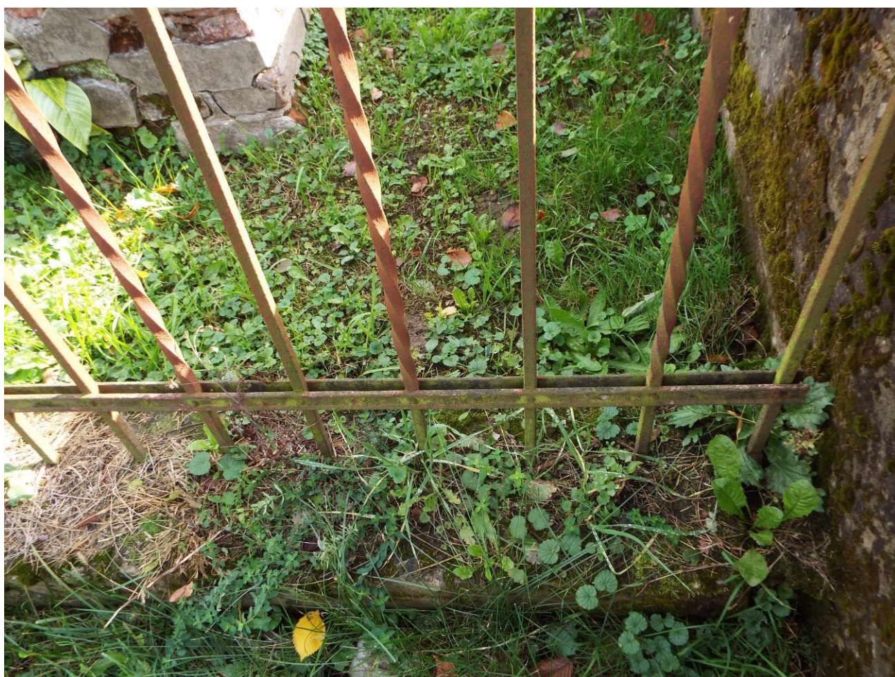
Stary Dzików, cmentarz komunalny, zespołu 3 nagrobków wraz z ogrodzeniem, 2023 r.