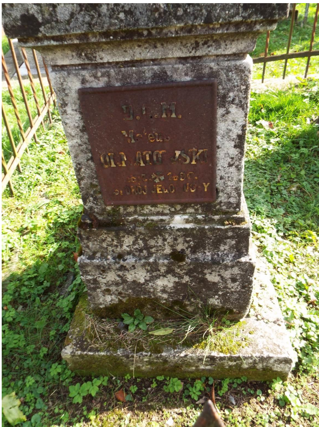
Stary Dzików, cmentarz komunalny, nagrobek Józefy Ornatowskiej i Mateusza Ornatowskiego, tablica z epitafium Mateusza Ornatowskiego, 2023 r.