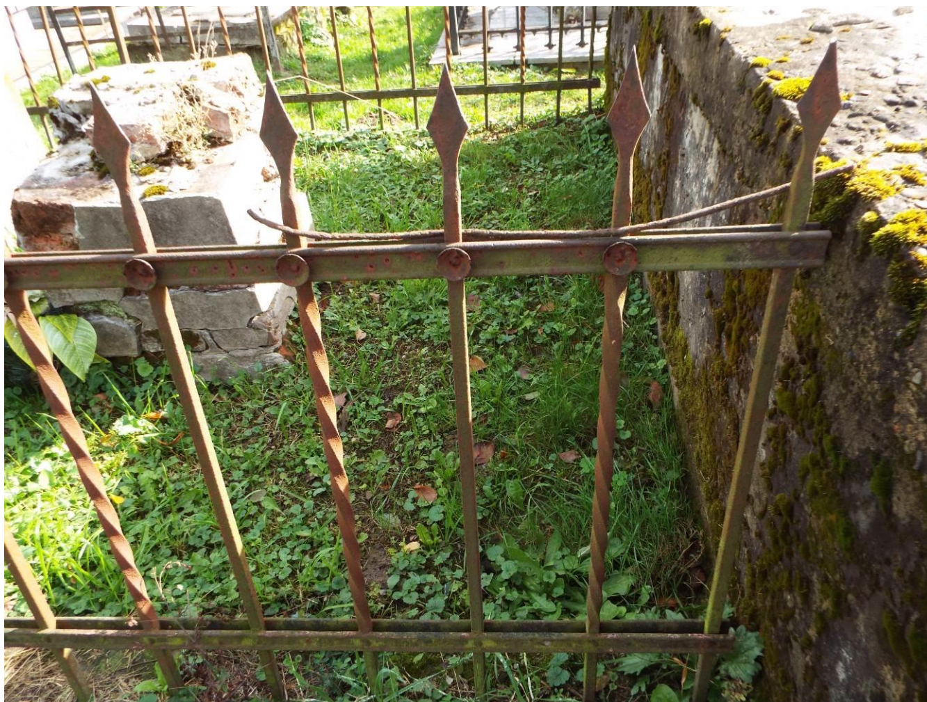
Stary Dzików, cmentarz komunalny, zespołu 3 nagrobków wraz z ogrodzeniem, 2023 r., fot. B. Woch