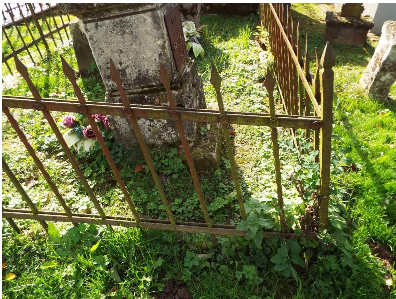
Sary Dzików, cmentarz komunalny, zespołu 3 nagrobków wraz z ogrodzeniem, 2023 r.