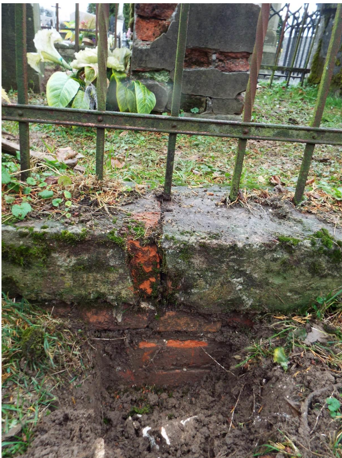
Stary Dzików, cmentarz komunalny, zespołu 3 nagrobków wraz z ogrodzeniem, 2023 r.