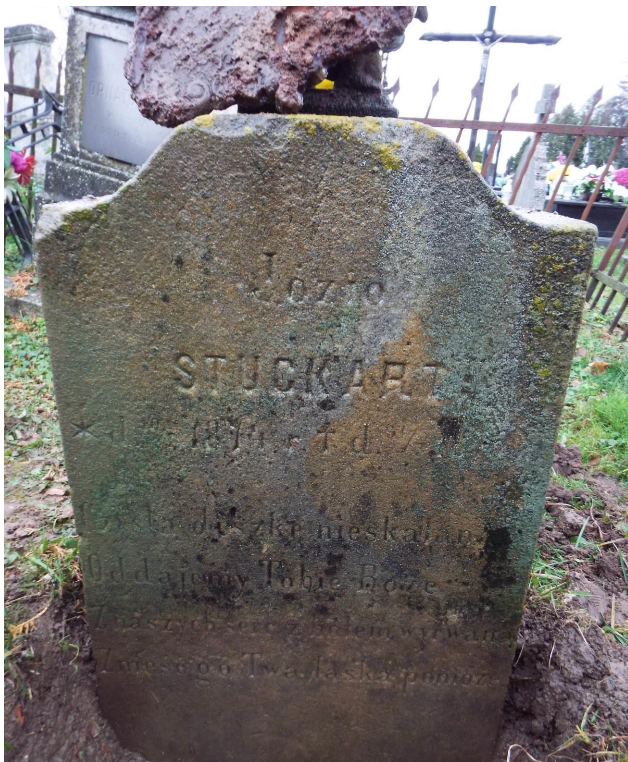
Stary Dzików, cmentarz komunalny, nagrobek Józia Stuckarta, 2023 r.