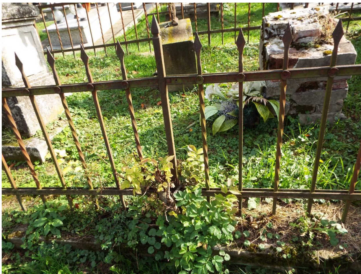
Stary Dzików, cmentarz komunalny, zespołu 3 nagrobków wraz z ogrodzeniem, 2023 r.