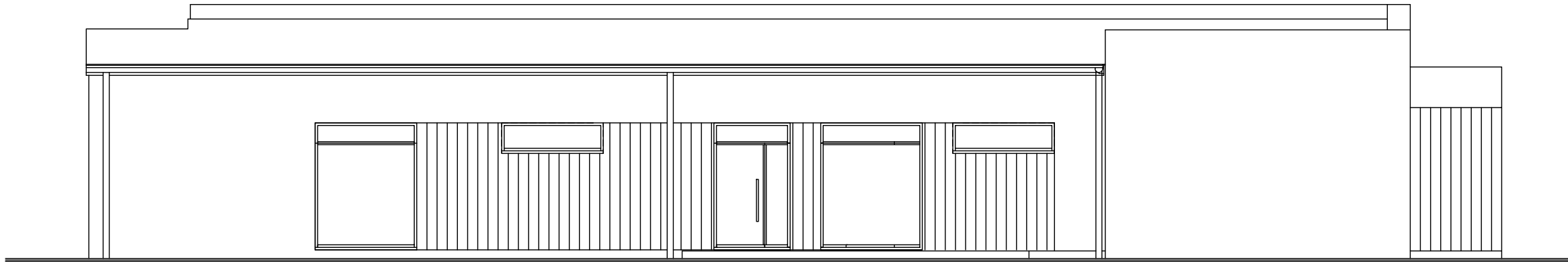
E L E W A C J A P O Ł U D N I O W A