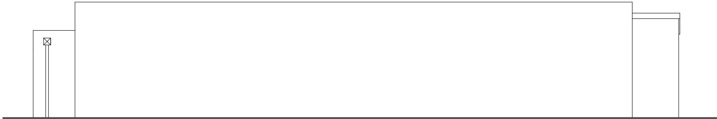
E L E W A C J A P Ó Ł N O C N A