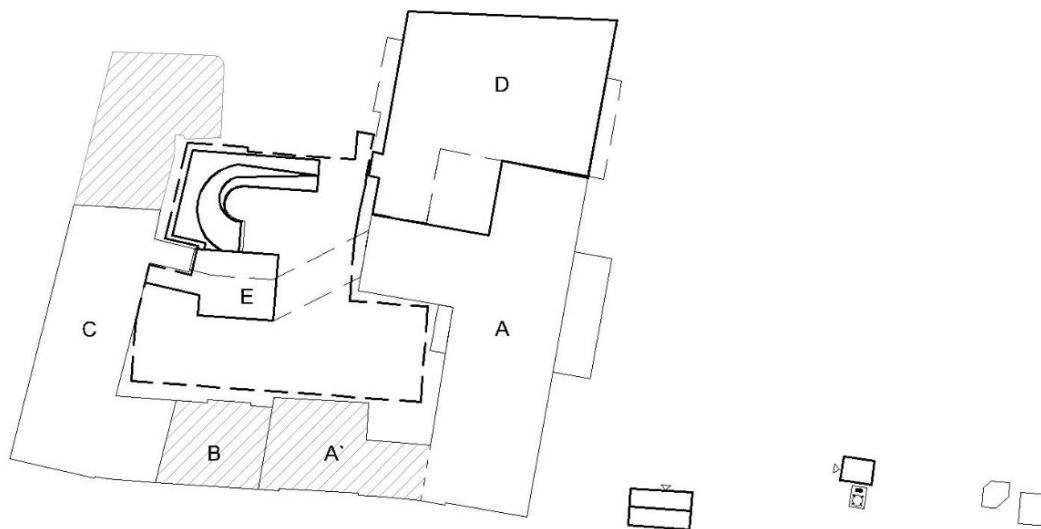
Schemat nazewnictwa budynków

Zasadniczą część inwestycji stanowi budynek „D”, „E” oraz „A” SCU św. Anny o łącznej powierzchni nowej zabudowy 1450,66m 2 , (budynek „A” - pozostaje bez zmian powierzchnia zabudowy), powierzchni netto 14 087,60m 2 , 5 kondygnacjach (1 podziemnej, 4 nadziemnych). Szpital z podziałem na oddziały o sumarycznej ilości łóżek szpitalnych 198. Budynkowi szpitala towarzyszy kompleksowe zagospodarowanie działki w postaci m.in.: parkingu podziemnego na 58 miejsc parkingowych, nowej stacji transformatorowej oraz nowego budynku tlenowni i uzbrojenia terenu.