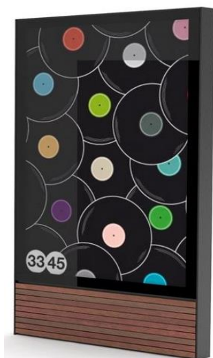
d. tablica city-light – 8 szt.