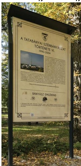
e. tablica informacyjno-edukacyjna – 1 szt.