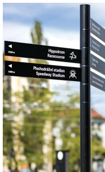
f. kierunkowskaz – 3 szt.