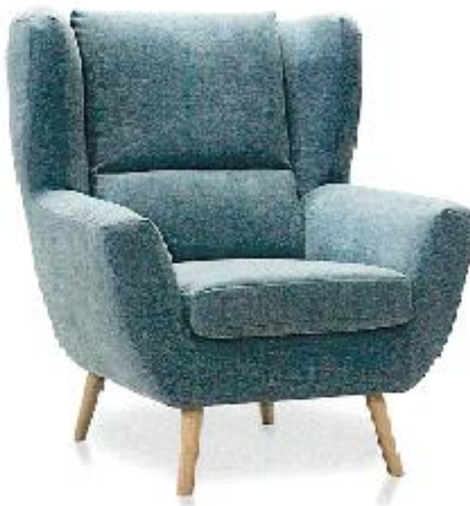
Zdjęcie poglądowe nr 5

Fotele należy oznakować symbolem WP8-5-22 pod spodem, na środku siedziska. Oznakowanie wykonać niezmywalnym markerem w kolorze białym. Wysokość i szerokość liter i cyfr ma mieć następujące wymiary: wysokość od 1,5 cm. do 2 cm.; szerokość od 0,5 cm. do 1 cm. Przykładowy wygląd fotela przedstawia zdjęcie poglądowe nr 5