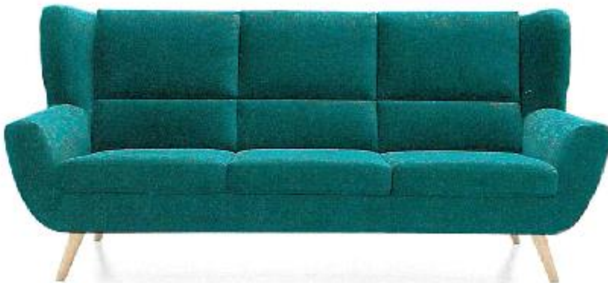
Zdjęcie poglądowe nr 4

Przykładowy wygląd sofy przedstawia zdjęcie poglądowe nr 4