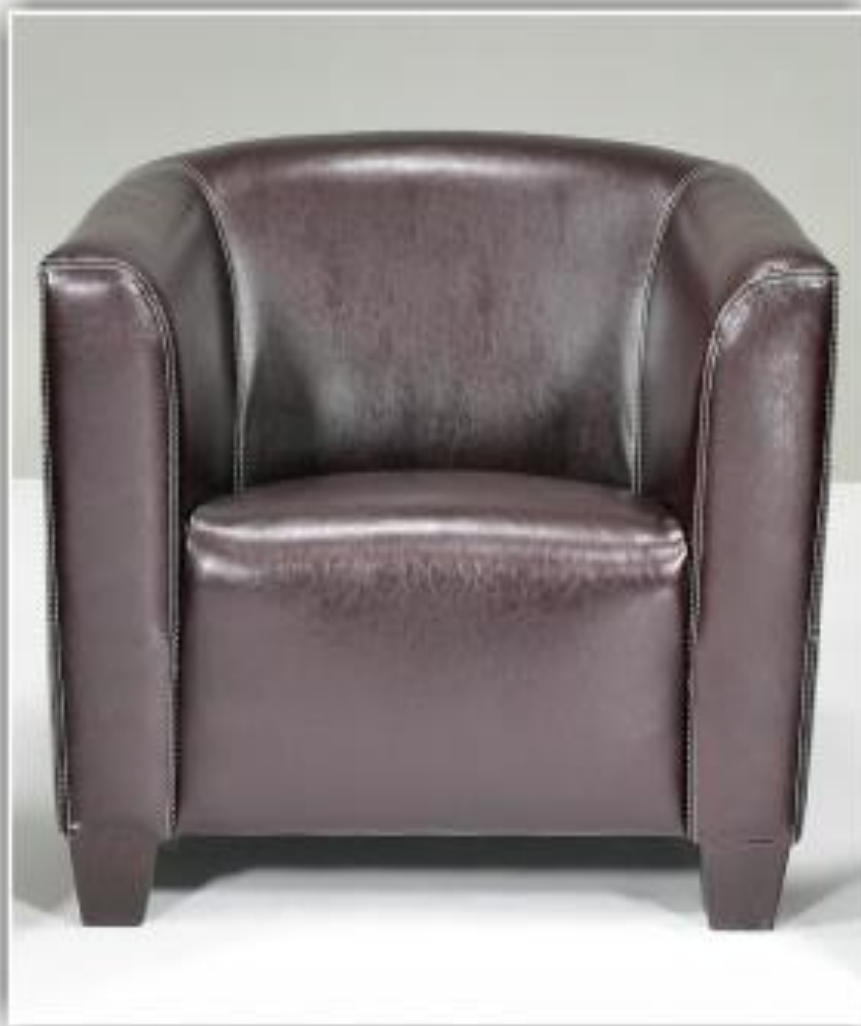
Zdjęcie poglądowe nr 13