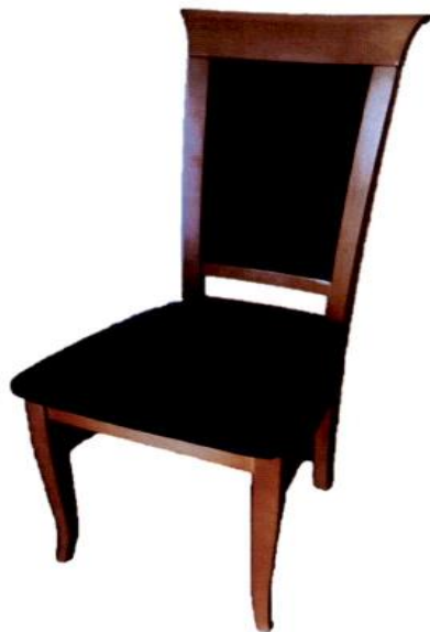
Zdjęcie pogładowe nr 7

Kolor wybarwienia drewna przedstawia zdjęcie pogładowe nr 8