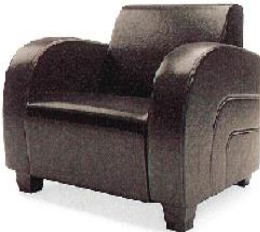
Zdjęcie poglądowe nr 1

Przykładowy wygląd fotela tapicerowanego przedstawia zdjęcie poglądowe nr 1