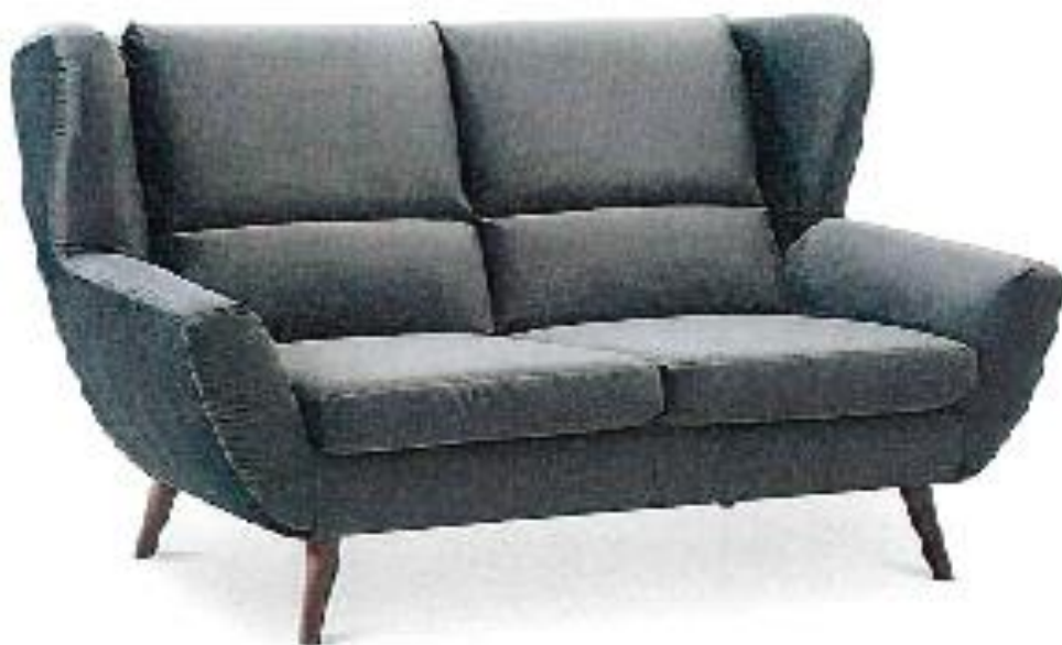
Zdjęcie poglądowe nr 3

Z tyłu sofy z prawej strony od góry należy umieścić trwale oznakowanie wojskowe WP8-18-22 . Oznakowanie wykonać niezmywalnym markerem w kolorze czarnym. Wysokość i szerokość liter i cyfr ma mieć następujące wymiary: wysokość od 1,5 cm. do 2 cm.; szerokość od 0,5 cm. do 1 cm. Przykładowy wygląd sofy przedstawia zdjęcie poglądowe nr 3