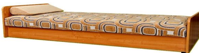
Zdjęcie poglądowe nr 9

Przykładowy wygląd tapczanu tapicerowanego przedstawia zdjęcie poglądowe nr 9.