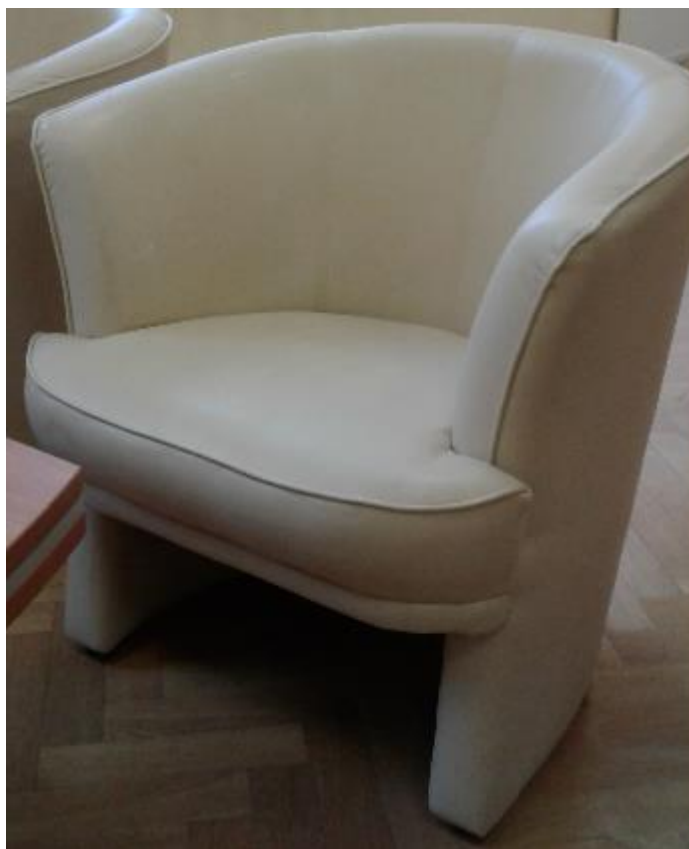
Zdjęcie poglądowe nr 6

Przykładowy wygląd fotela tapicerowanego przedstawia zdjęcie poglądowe nr 6