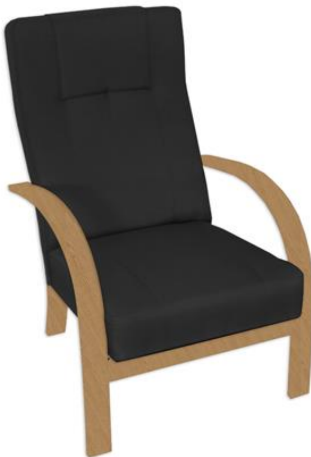
Zdjęcie poglądowe nr 12

Wzór fotela biurowego wyściełanego przedstawia zdjęcie poglądowe nr 12.