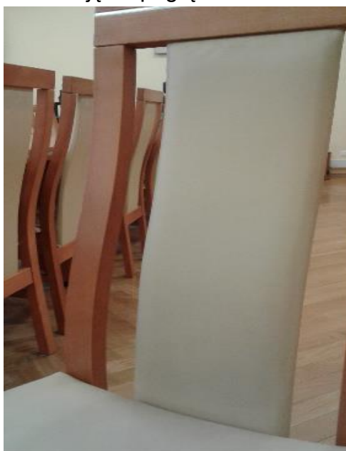
Zdjęcie pogładowe nr 8

Kolor wybarwienia drewna przedstawia zdjęcie pogładowe nr 8