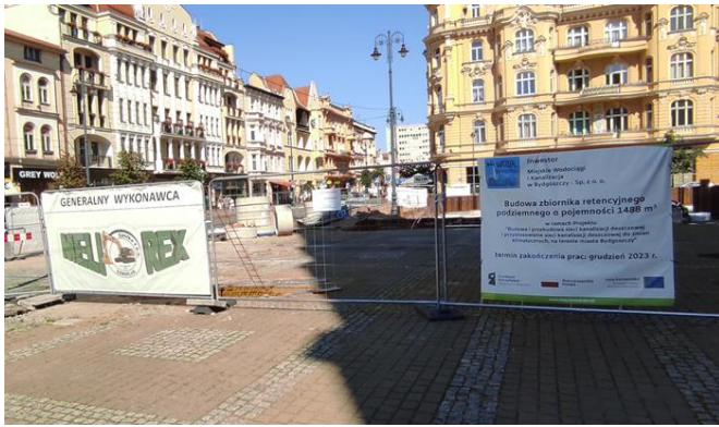
Fotografia 1. Prace prowadzone na Placu Wolności stan na dzień 08.09.2023 r.

Wykonawca wnosi o potwierdzenie, że na dzień przekazania placu budowy wszelkie roboty na tym obszarze będą zakończone, a Wykonawca nie będzie zobowiązany do koordynowania prac.