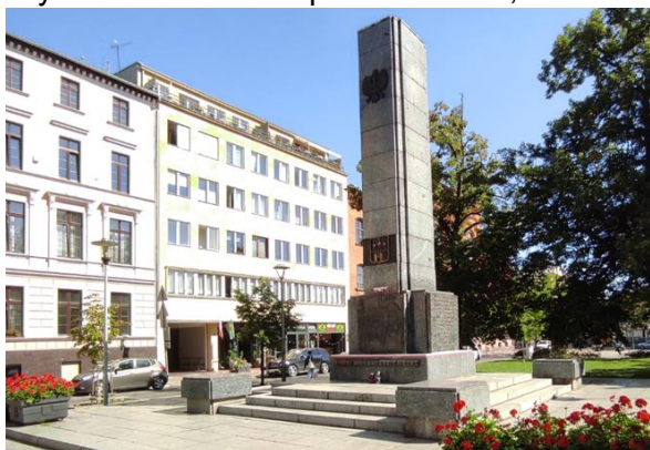
Fotografia 2. Widok na Pomnik Wolności stan na dzień 08.09.2023 r.

Wykonawca wnosi o potwierdzenie, że zadanie nie obejmuje renowacji Pomnika Wolności.