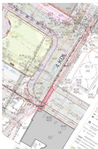
Rysunek 2. Wyróżnienie różnic pomiędzy '4 Rys Z02'