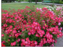
2 - róża okrywowa 'Marathon' Rosa 'Marathon'