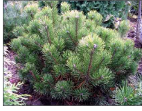
lub sosna górka 'Mughus' Pinus mugo var. Mughus