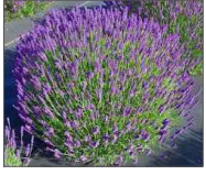
1 - lawenda wąskolistna Lavandula angustifolia