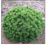
3 - sosna górka 'Mops' Pinus mugo 'Mops'