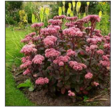
lub rozchodnik 'Matrona' Sedum 'Matrona'