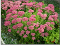
4 - rozchodnik okazały 'Brilliant' Sedum spectabile 'Brilliant'