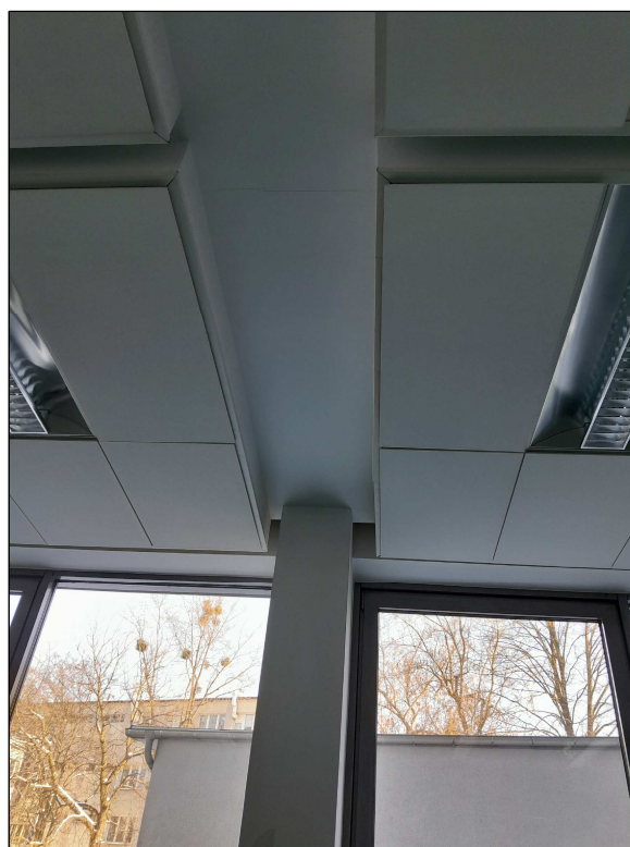
fot.6 - podciąg