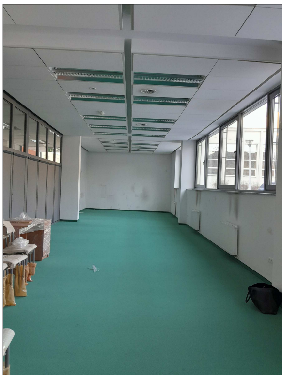
fot.7 - widok pomieszczenia