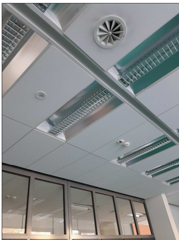
fot.5 - podwieszany saufit z "osprzętem"