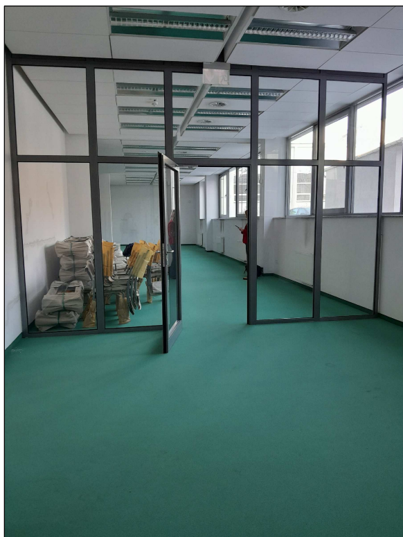
fot.3 - wewnętrzna szklana ściana