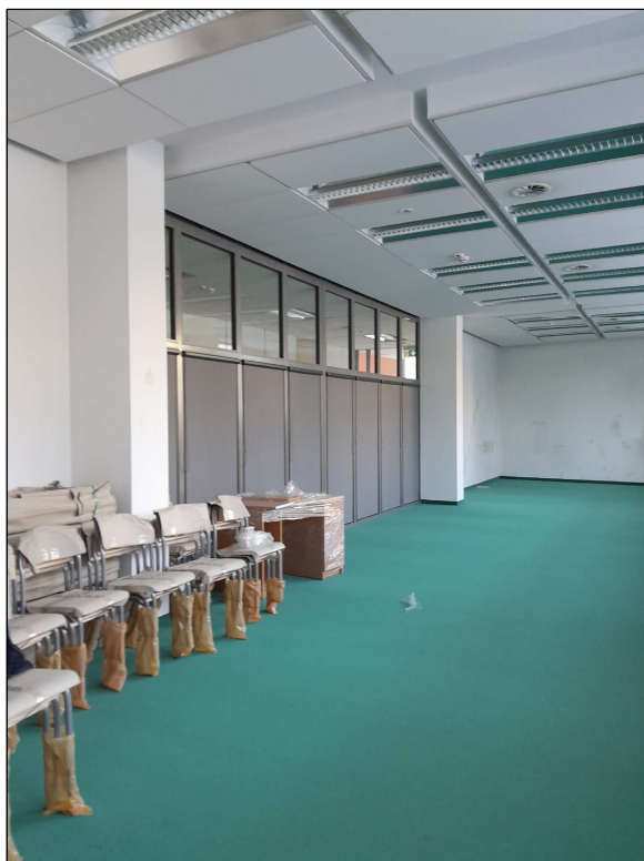
fot.2 - duże przeszklenia na ścianie graniczącej z korytarzem