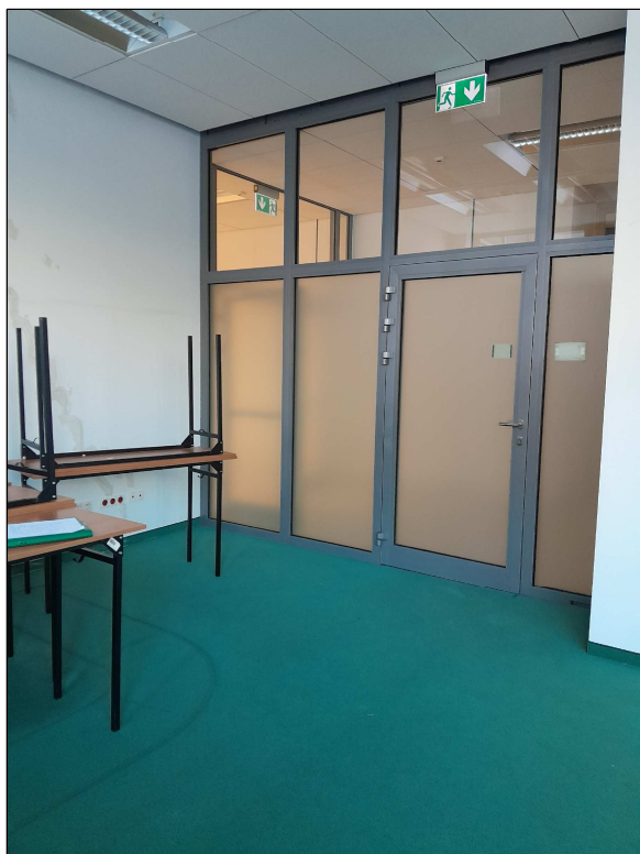
fot.1 - wejście do pomieszczenia