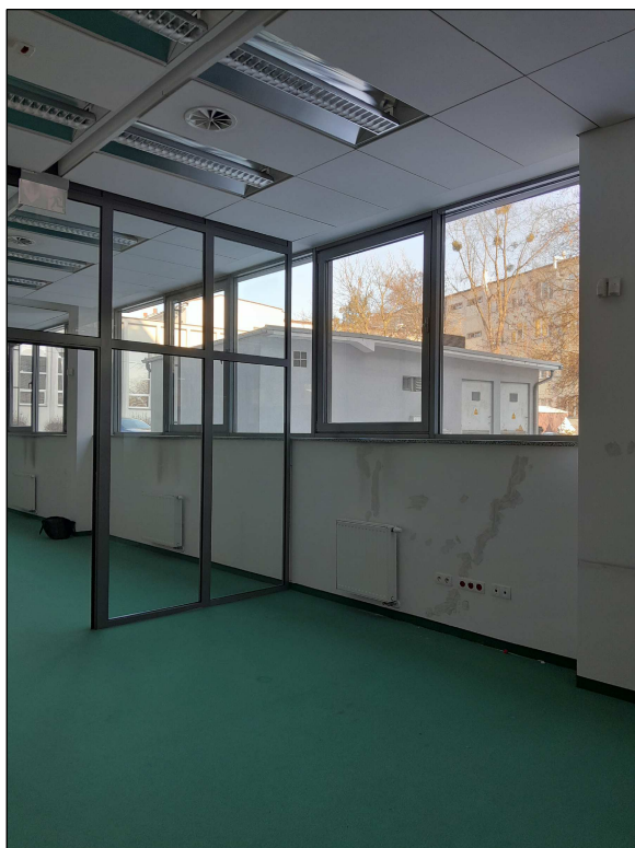
fot.4 - rzędy okien