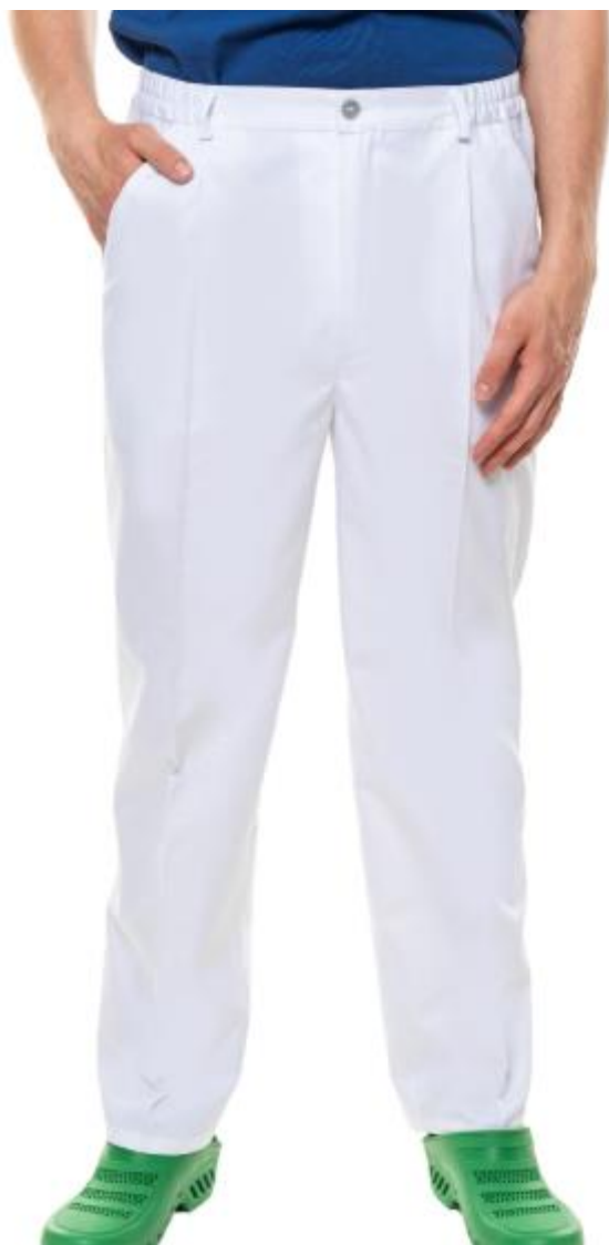
Pozycja 5 spodnie męskie KLASYCZNE