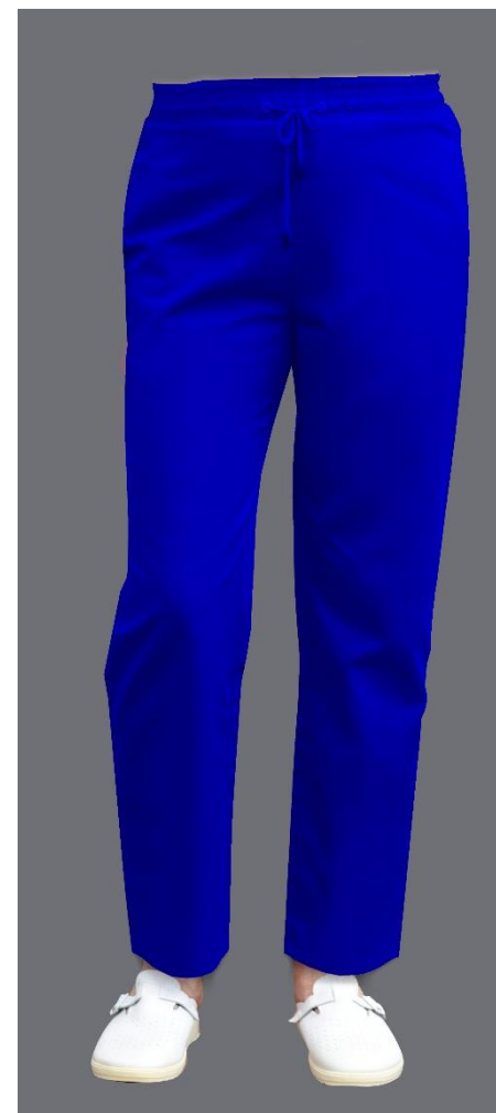
Pozycja 2 spodnie damskie PROSTE