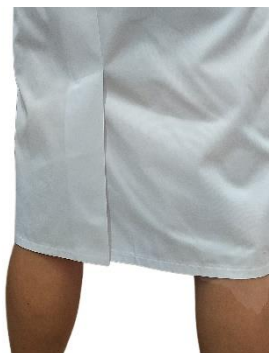
Pozycja 3 spódnica SPORT