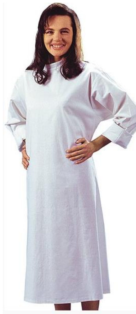
Pozycja 1 część 2 Fartuch zapaska