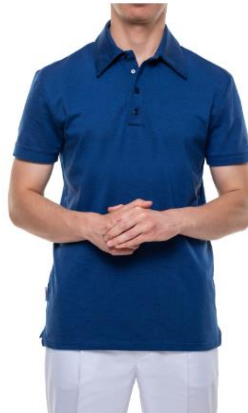
Pozycja 2 część 3 polo męskie SYLWESTER