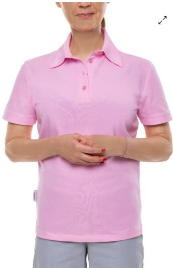
Pozycja 1 część 3 polo damskie MARY