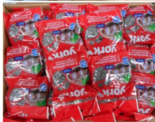
ułożenie w kartonie