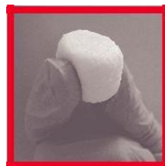
Łatwe kształtowanie i modelowanie