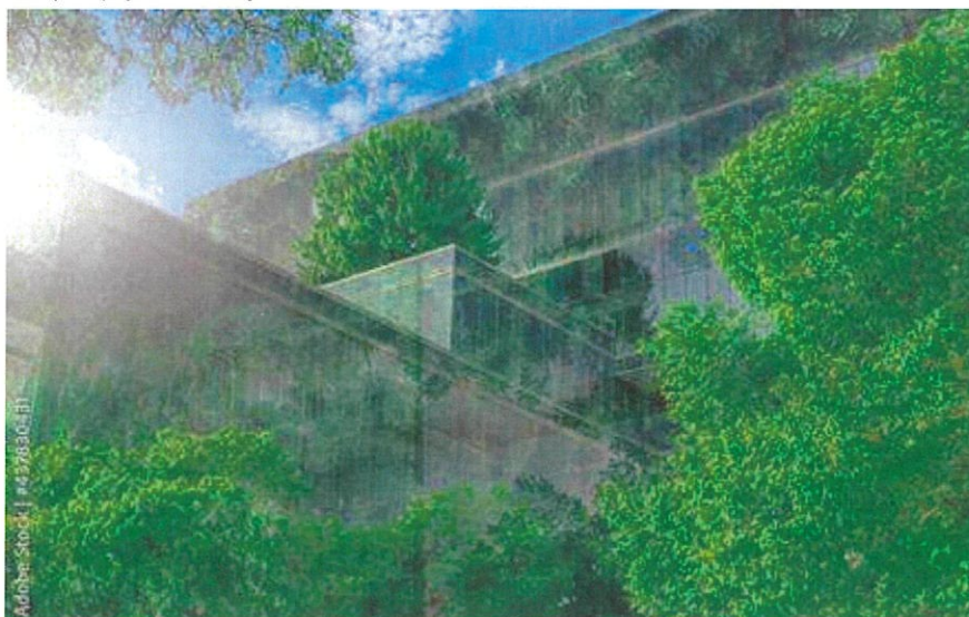
Rysunek 1