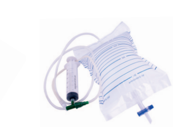
Zestaw z zaworem jednokierunkowym