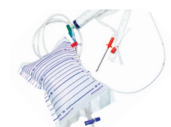
Zestaw z miękkim cewnikiem i zaworem jednokierunkowym