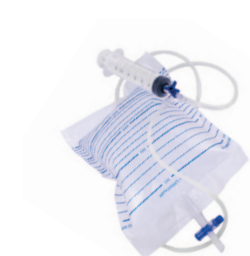
Zestaw z kranikiem 3-drożnym

Produkt jednorazowego użytku, sterylizowany tlenkiem etylenu.