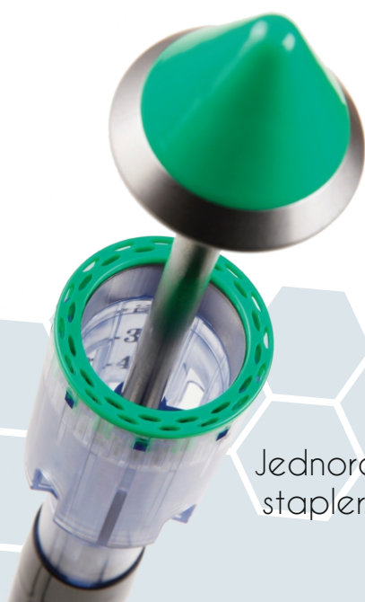
Jednorazowe staplery PPH