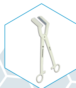
Kapciuchownica jednorazowego użytku