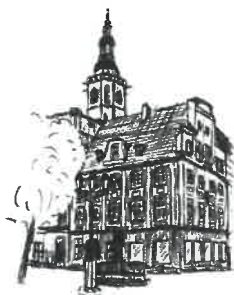
Rynek Wieża ratuszowa

Sporządziła: I. Fecko Stanowisko: Inspektor tel. 74 856-28-50