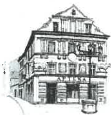
Kamienica „Pod Bykami”