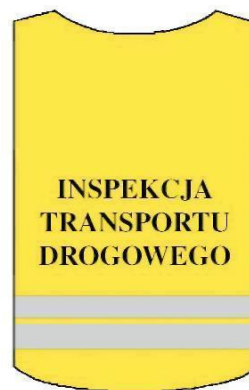
Kamizelka ostrzegawcza tył