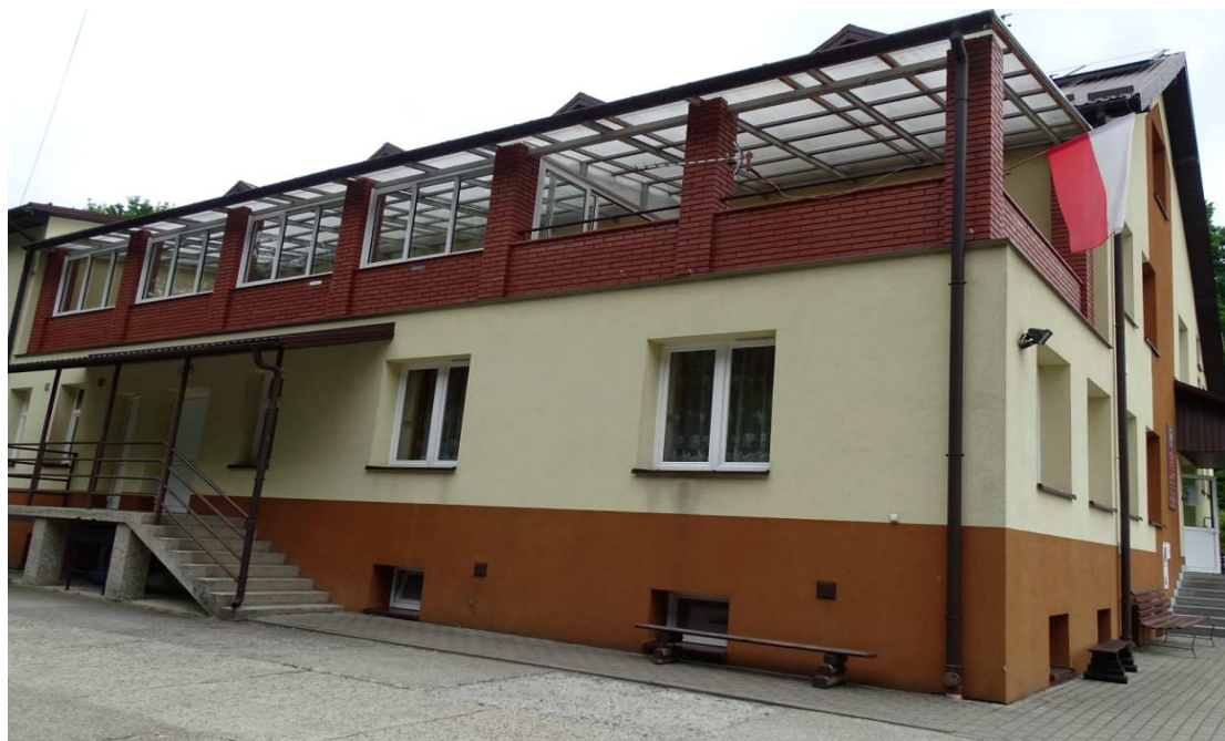
ELEWACJA ZACHODNIA- FRAGMENT