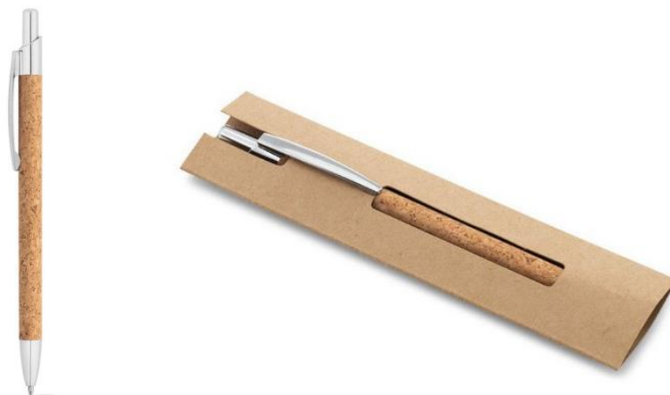
Rysunek 4 Zdjęcie poglądowe długopis

Kolor wkładu: niebieski, ilość sztuk: 800.