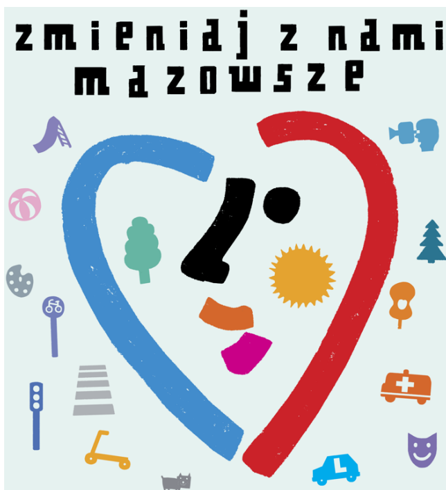
Rysunek 10 Plakat promujący BOM