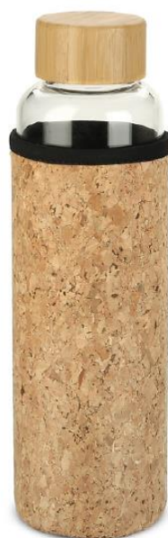
Rysunek 5 Zdjęcie poglądowe butelka