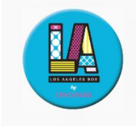
Rysunek 6 Zdjęcie poglądowe przypinka