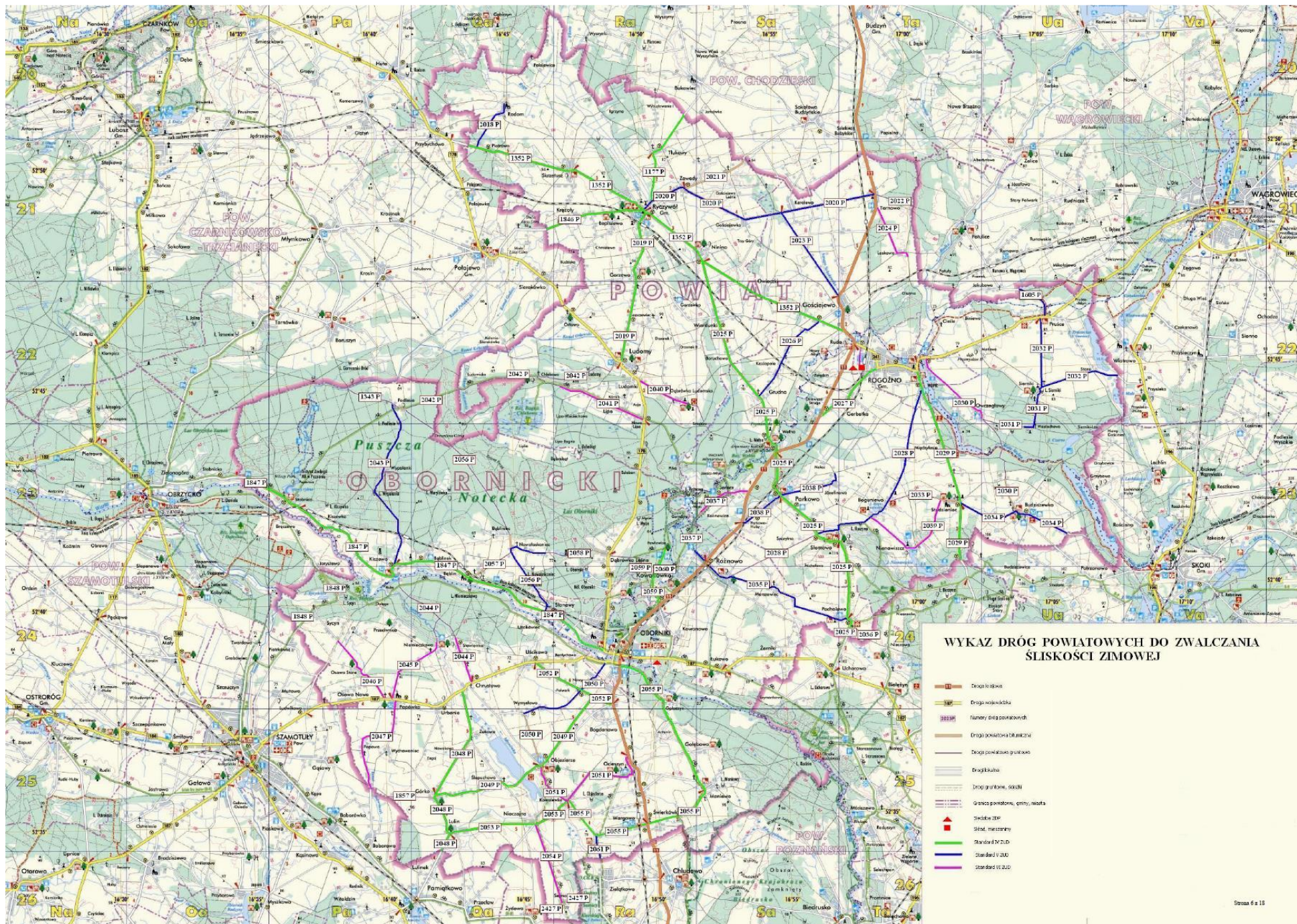
Powiat Obornicki – Zarząd Dróg Powiatowych w Obornikach, ul. Rolna 17, 64-610 Rogoźno