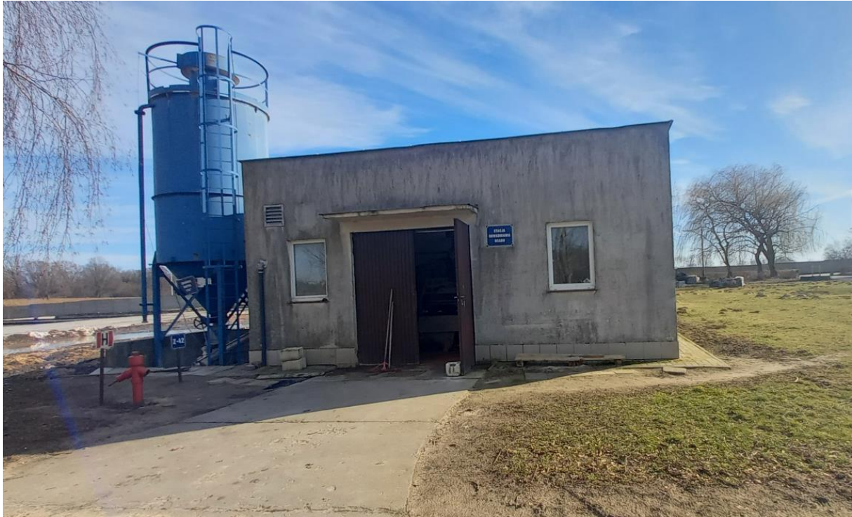
Zdjęcie 5. Stacja mechanicznego odwadniania, higienizacji i granulacji osadu + zasobnik wapna, obiekt nr 12

Bilans ścieków należy uaktualnić, w konsekwencji czego wskazane w całym zakresie rzeczowym obliczenia technologiczne należy również sprawdzić/ zaktualizować na etapie projektowania