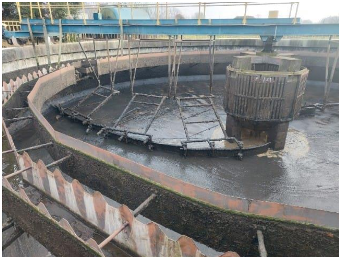
Zdjęcie 4. Osadnik wtórny, obiekt nr 8