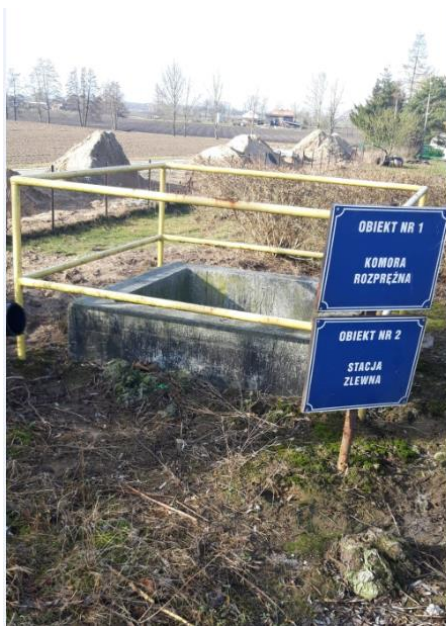
Zdjęcie 1. Komora rozprężna, obiekt nr 1

W ramach niniejszego zadania przewiduje się kompletny remont budowlany obiektu z uzupełnieniem izolacji przeciwwodnych wraz z wymianą istniejących barierek na barierki ze stali AISI304 zamocowane za pomocą śrub ze stali 1.4301 AISI 304