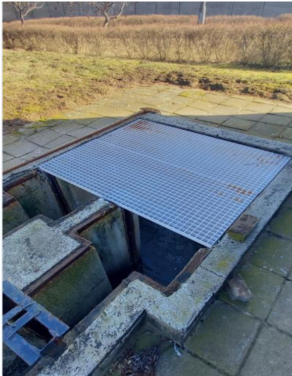
Zdjęcie 2. Komora przelewu burzowego, obiekt nr 5.1