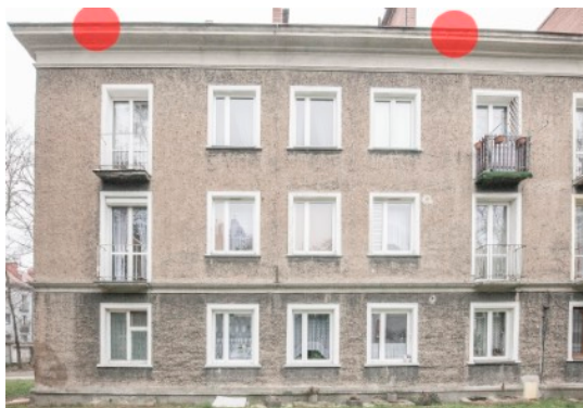
Fot. 5. Budynek ul. Bończyka 29, 29a w Tarnowskich Górach Zaznaczono potencjalne siedliska lęgowe jerzyka - czerwone punkty.