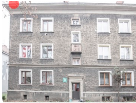
Fot. 2. Budynek ul. Bończyka 29, 29a w Tarnowskich Górach Zaznaczono potencjalne siedlisko łęgowe jerzyka - czerwony punkt.