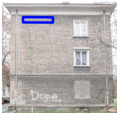
Fot. 4. Budynek ul. Bończyka 29, 29a w Tarnowskich Górach Propozycja zlokalizowania budek łęgowych dla jerzyka - niebieska ramka.