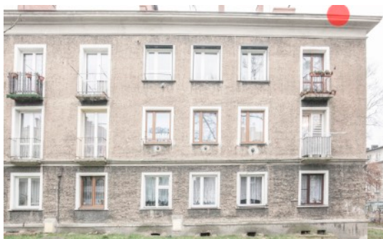
Fot. 6. Budynek ul.Bończyka 29, 29a w Tarnowskich Górach Zaznaczono potencjalne siedlisko lęgowe jerzyka - czerwony punkt.