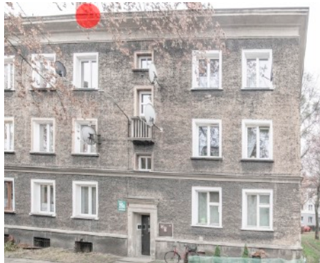
Fot. 3. Budynek ul. Bończyka 29, 29a w Tarnowskich Górach Zaznaczono potencjalne siedlisko łęgowe jerzyka - czerwony punkt.