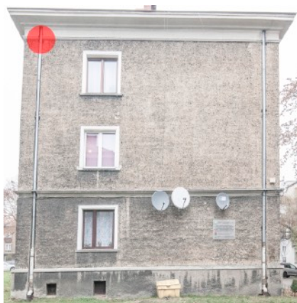
Fot. 7. Budynek ul. Bończyka 29, 29a w Tarnowskich Górach Zaznaczono potencjalne siedlisko lęgowe jerzyka - czerwony punkt.