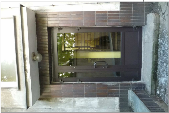
WEJŚCIE DO KLATKI SCHODOWEJ