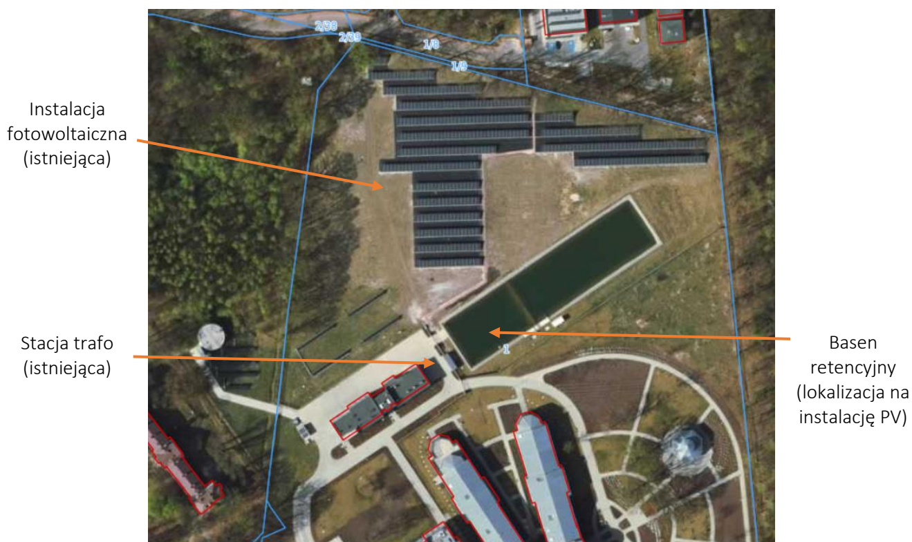
Rysunek 4. Obszar inwestycji

Obszar inwestycji znajduje się w północnej części działki, w której zlokalizowane są istniejące instalacje elektroenergetyczne. Plan sytuacyjny, na którym wskazano proponowaną lokalizację inwestycji pokazano na Rysunek 4.