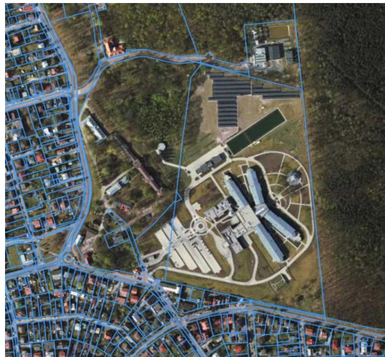
Rysunek 2. Widok działki