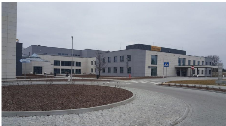
Rysunek 3. Budynek szpitala

Obszar inwestycji znajduje się w północnej części działki, w której zlokalizowane są istniejące instalacje elektroenergetyczne. Plan sytuacyjny, na którym wskazano proponowaną lokalizację inwestycji pokazano na Rysunek 4.