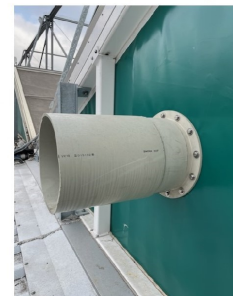
Widok z zewnątrz bioreaktora