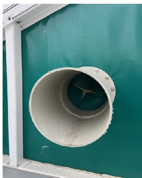
Widok z zewnątrz bioreaktora

Wizualizacja planowanych do wykonania odciągów powietrza z istniejących bioreaktorów pracujących w systemie Biodegma (5 szt)