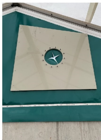
Widok z wnętrza bioreaktora