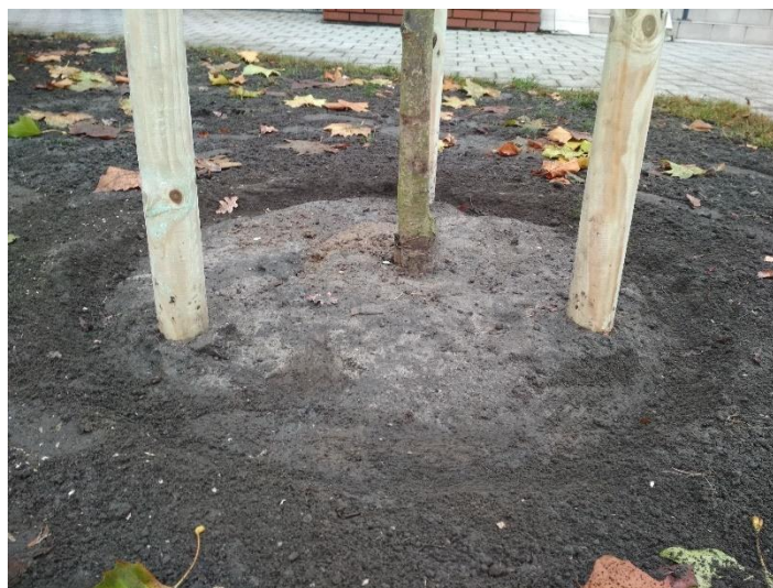
Ryc. 1 - Przykładowa misa do podlewania drzew.