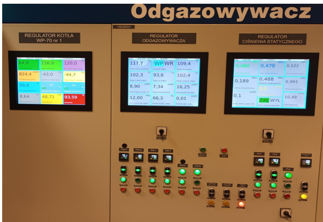
Regulator ciśnienia statycznego.