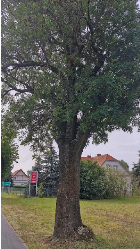
Drzewo nr 1, gatunek jesion obwód pnia na wys. 130 cm – 236 cm

W liniach rozgraniczających planowanej inwestycji znajdują się drzewa przeznaczone do wycinki: