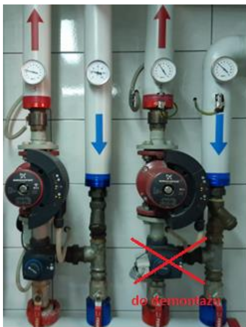
Rysunek 2. Istniejąca armatura