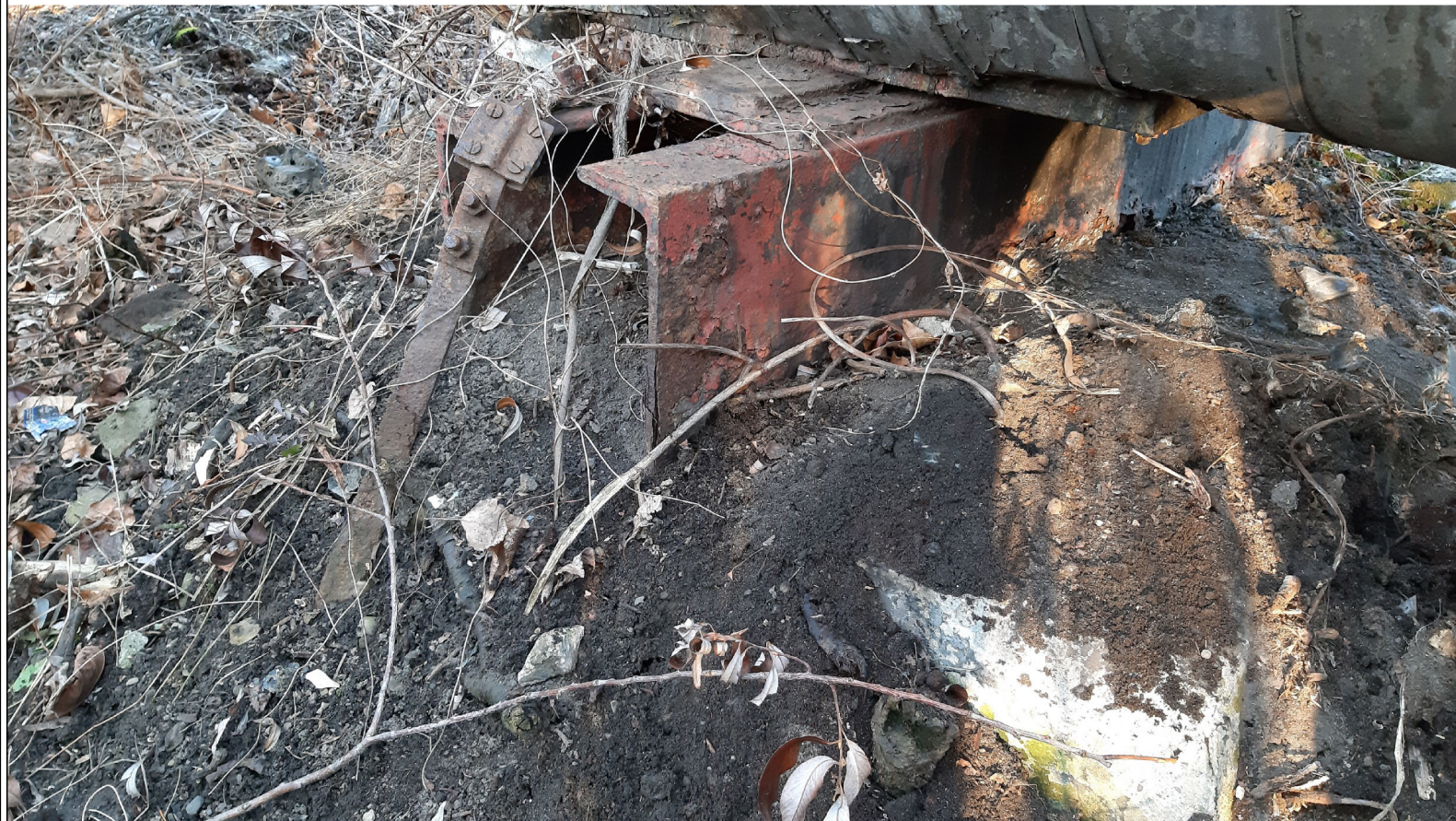
PODPORA ŚLIZGOWA P-89