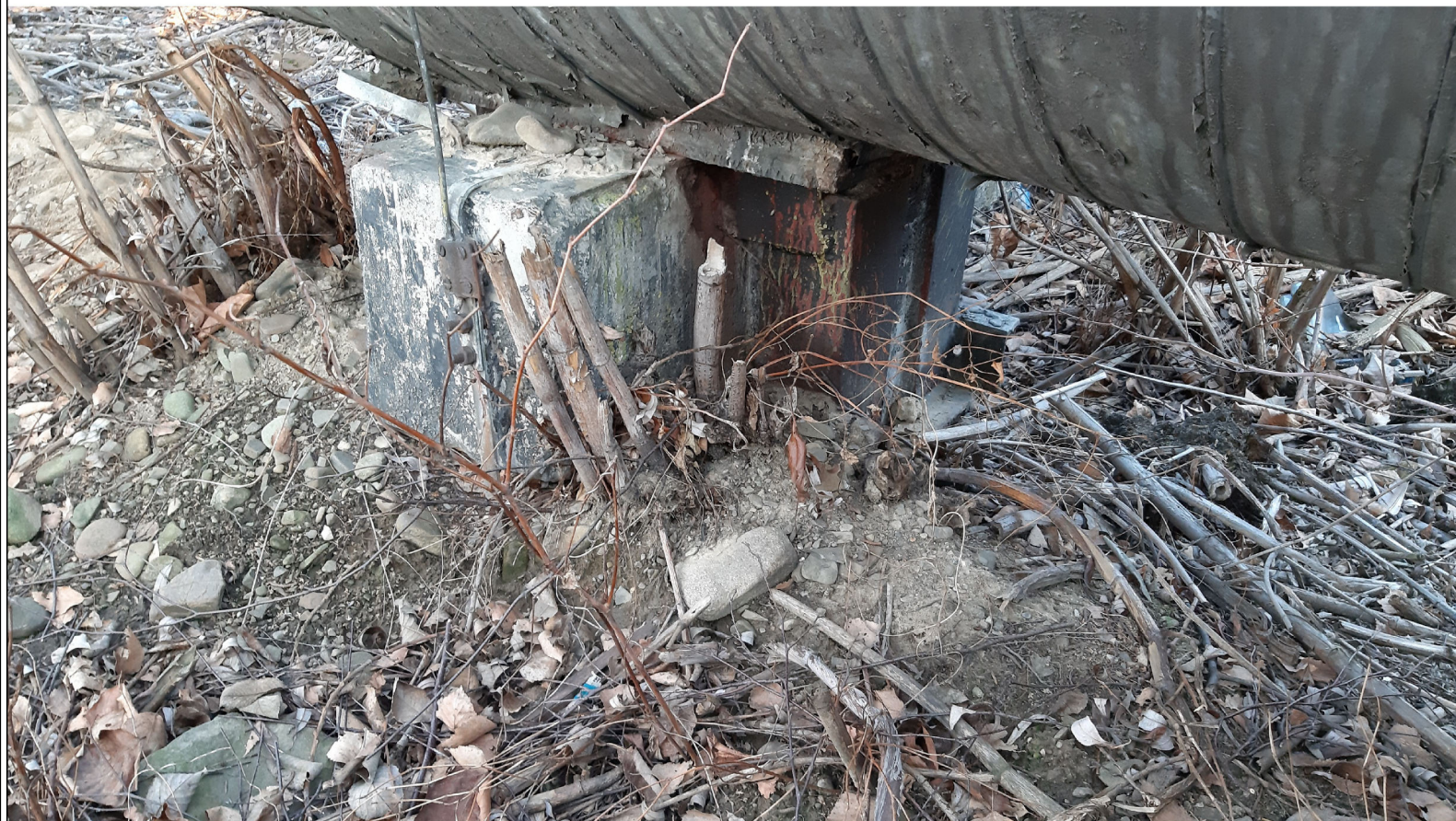
PODPORA ŚLIZGOWA P-86