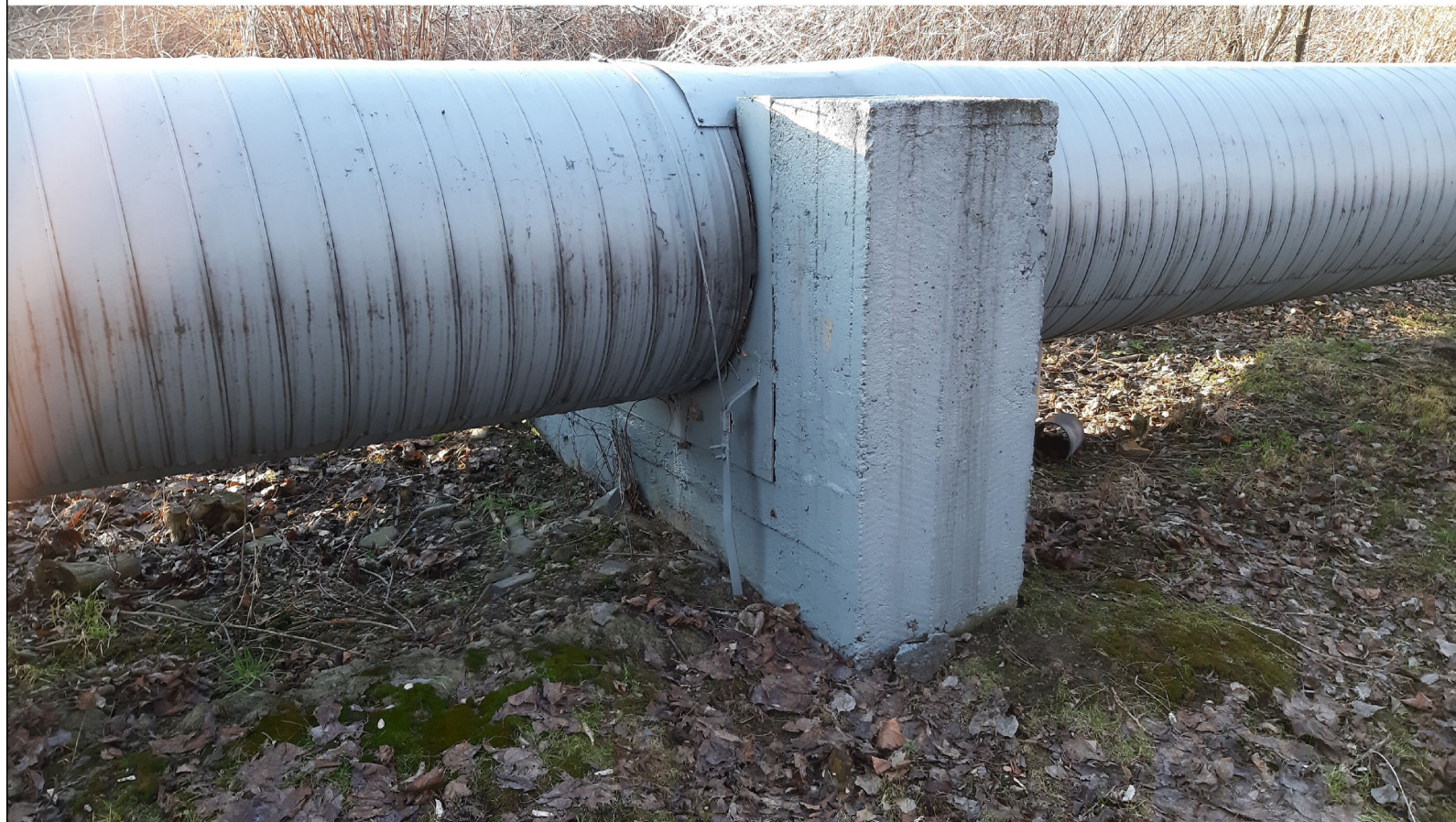
PUNKT STAŁY PS-19