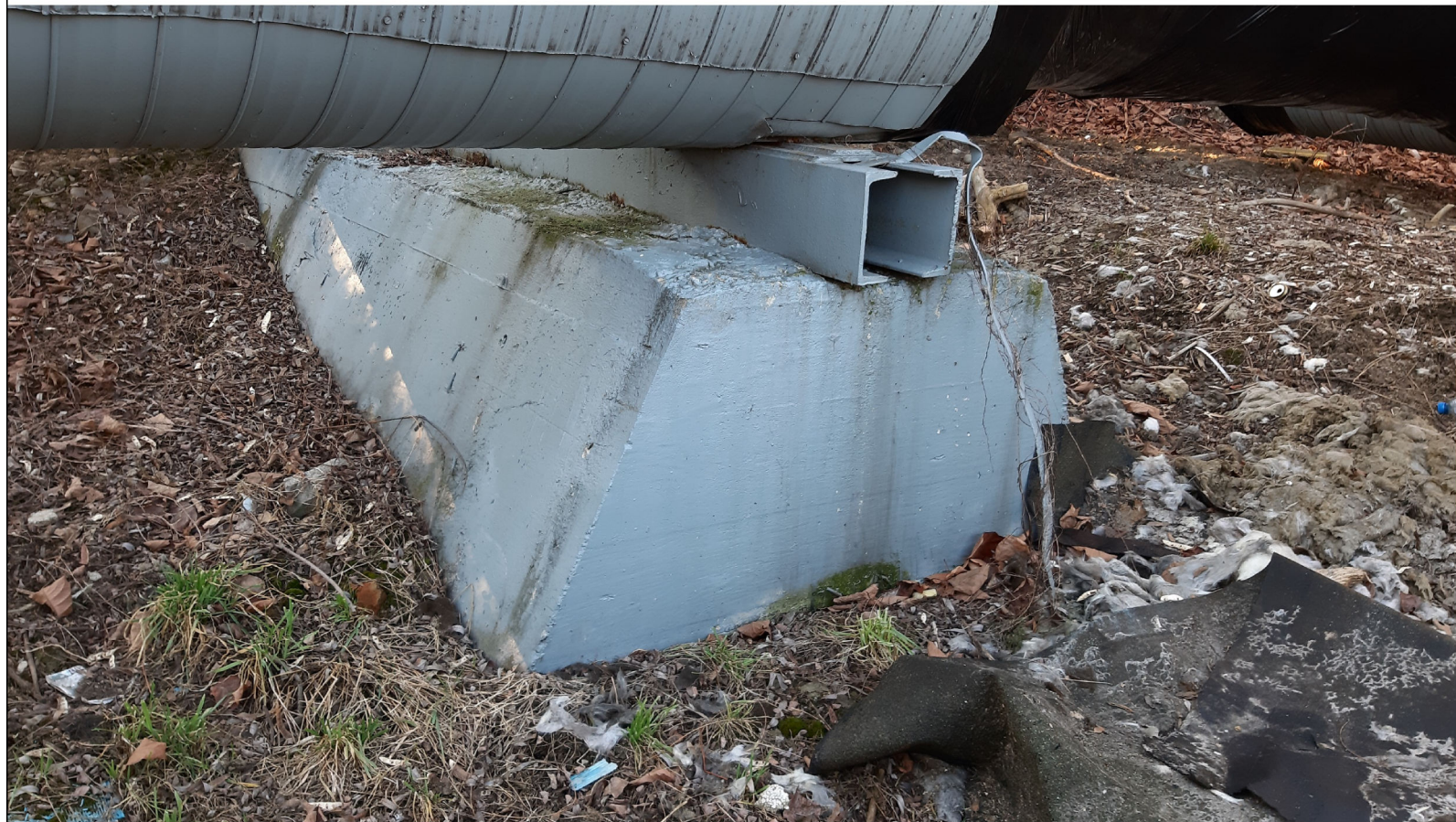
PODPORA ŚLIZGOWA P-103