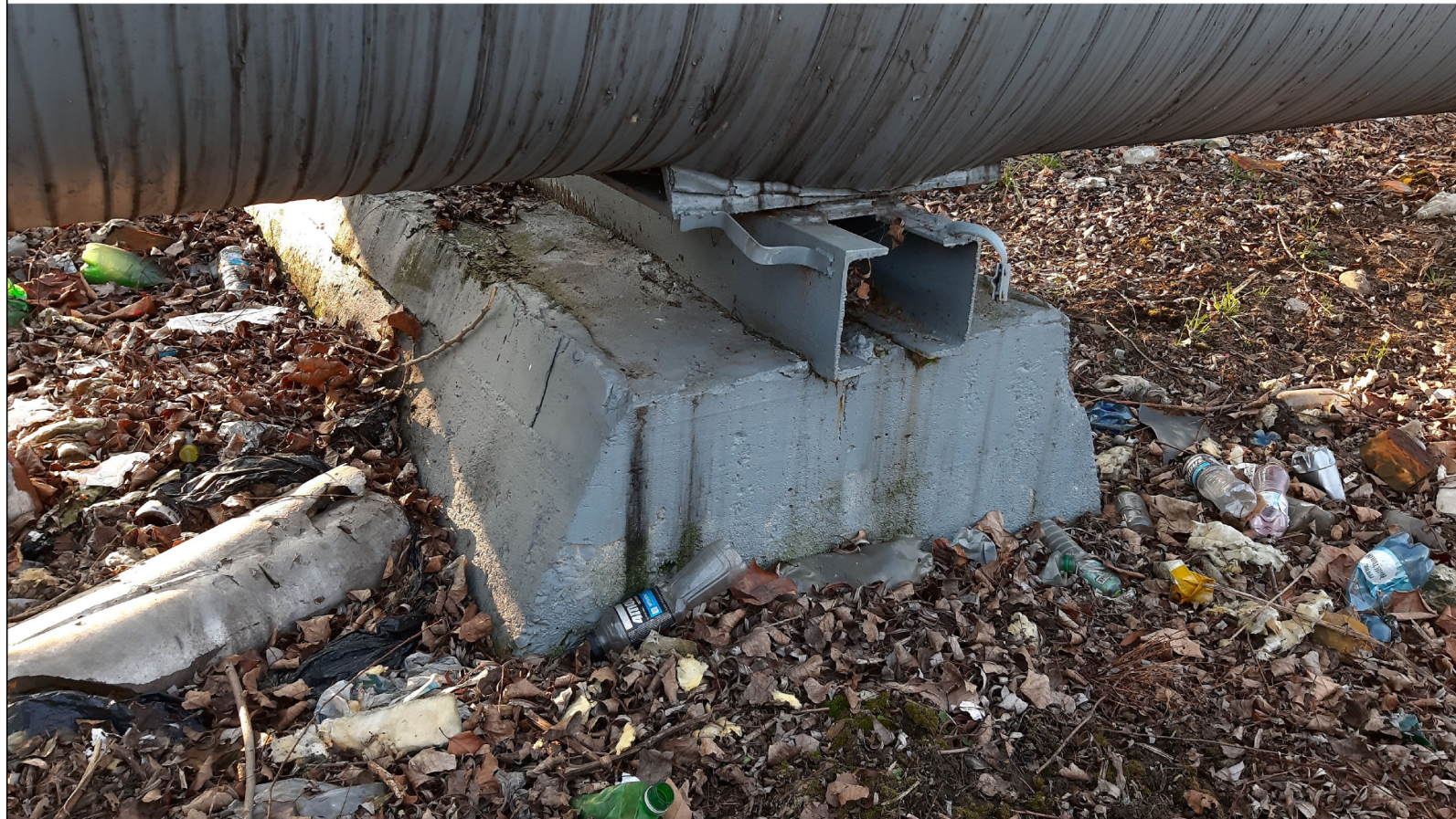
PODPORA ŚLIZGOWA P-93