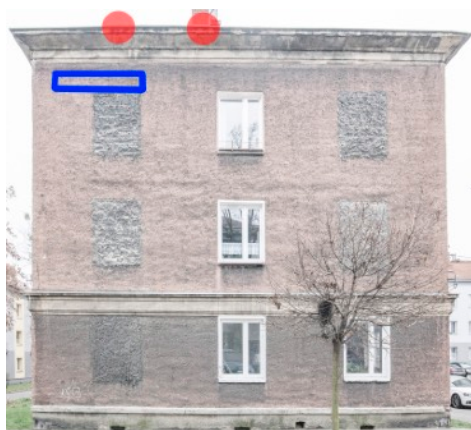
Fot. 6. Budynek ul.Bończyka 24, 24a, 24b w Tarnowskich Górach Zaznaczono potencjalne siedliska lęgowe jerzyka - czerwone punkty. Propozycja zlokalizowania budek lęgowych dla jerzyka - niebieska ramka.