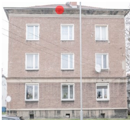
Fot. 3. Budynek ul. Bończyka 24, 24a, 24b w Tarnowskich Górach Zaznaczono potencjalne siedlisko łęgowe jerzyka - czerwony punkt.