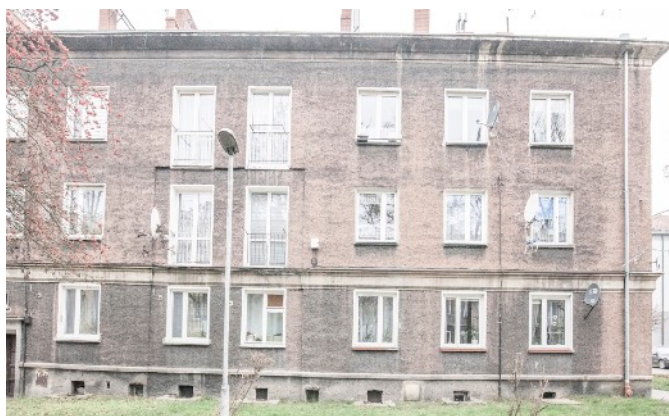
Fot. 5. Budynek ul. Bończyka 24, 24a, 24b w Tarnowskich Górach