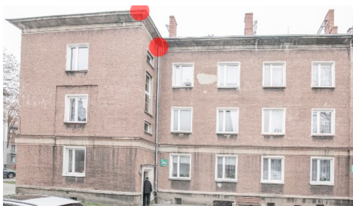
Fot. 7. Budynek ul. Bończyka 24, 24a, 24b w Tarnowskich Górach Zaznaczono potencjalne siedliska lęgowe jerzyka - czerwone punkty.