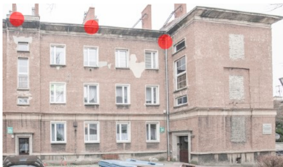
Fot. 2. Budynek ul. Bończyka 24, 24a, 24b w Tarnowskich Górach Zaznaczono potencjalne siedliska łęgowe jerzyka - czerwone punkty.