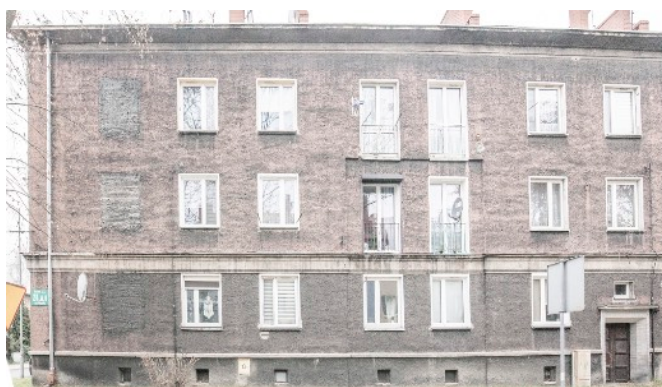
Fot. 4. Budynek ul. Bończyka 24, 24a, 24b w Tarnowskich Górach