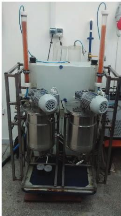
Rys. 1. Istniejąca instalacja wielkolaboratoryjna do produkcji biogazu.