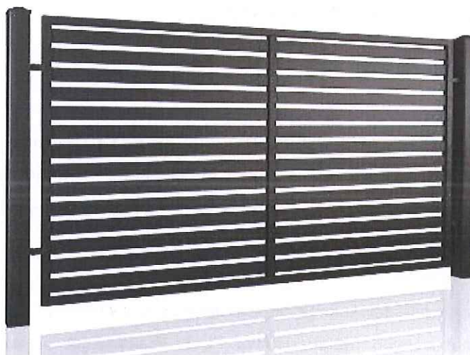
zdjęcie poglądowe ogrodzenia