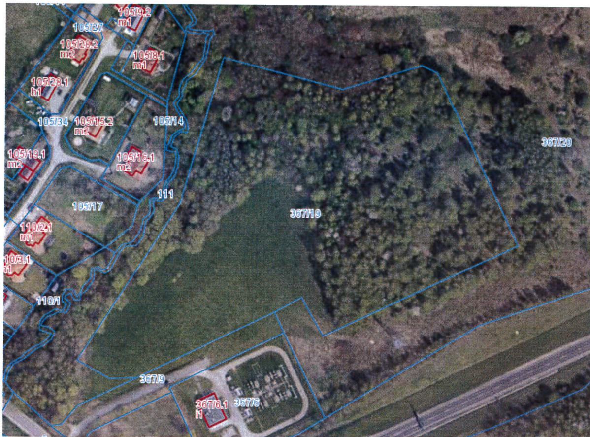
Rysunek 1 Lokalizacja planowanej inwestycji

Panele fotowoltaiczne o mocy około 330-405 Wp (lub wyższej) zostaną zamontowane na konstrukcji wsporczej posadowionej bezpośrednio na gruncie. Liczba rzędów i ilości w nich posadowionych urządzeń powinna być zaprojektowana w sposób umożliwiający maksymalizację dostępu do słońca.