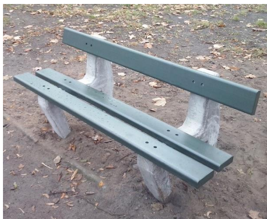
ławka model nr 4