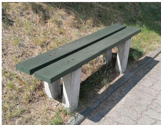
ławka model nr 5