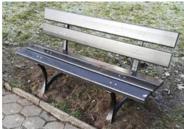
Model nr 2b