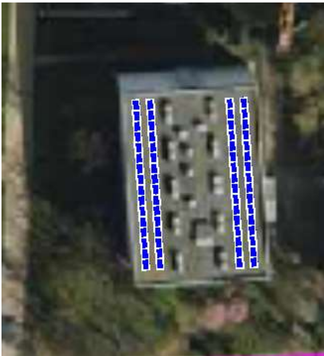
- DS. Medyk: