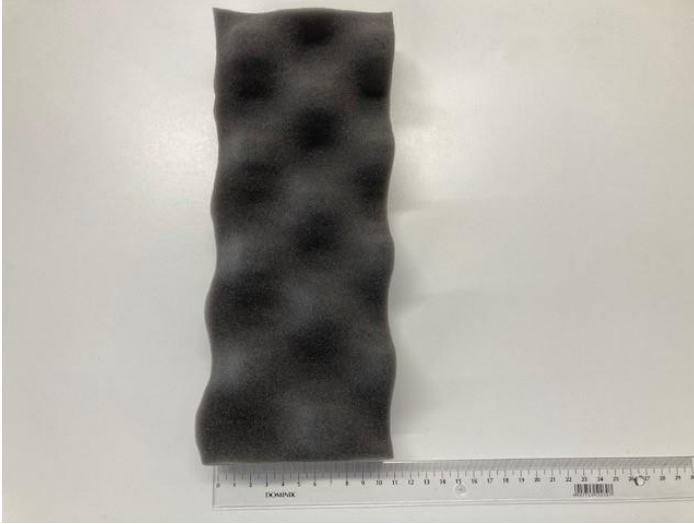
zdj. 3. gąbka „110”