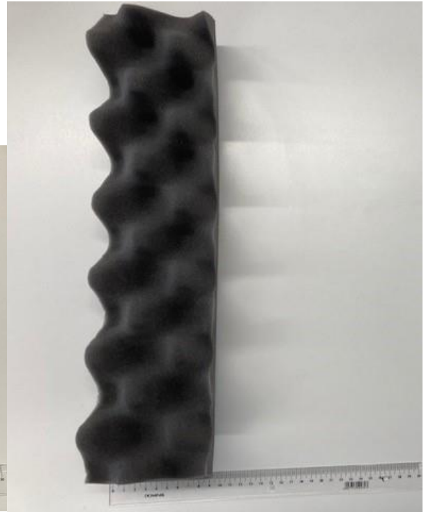
zdj. 3. gąbka „160”