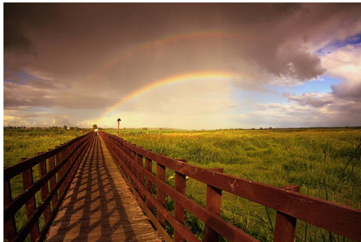
Rys.4. Przykładowa koncepcja kładki z barierką drewnianą.