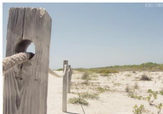
Rys.8. Przykładowa koncepcja wygradzenia terenu plaży w rezerwacie barierką drewnianą.

Plaża znajdująca się na terenie rezerwatu przyrody musi zostać wygradzona zarówno od strony północnej, jak i południowej. Wygradzenie od strony północnej (ok. 65 m) ma zostać ulokowane na działce nr 18 na granicy z działką 1/12, zaś wygradzenie od strony południowej (ok. 45 m) ma zostać ulokowane na działce 69/5 w granicy z działką 99/5. Wygradzenie zostanie zamontowane poprzez wbicie pali, na których zostanie zawieszony sznur. Ogrodzenie ma mieć wysokość do 100 cm. i ma zostać zlokalizowane od wyznaczonego szlaku pieszego po linię brzegową w granicach działek podanych powyżej. Dodatkowo zostaną zamontowane dwie tablice informacyjne o rezerwacie zlokalizowane od strony północnej i południowej, więcej informacji na temat tablic zostało zawarte w pkt.f) poniżej.