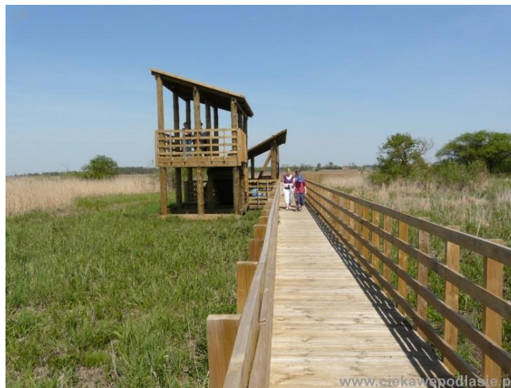
Rys.6. Przykładowa kładka wraz z wieżą widokową.