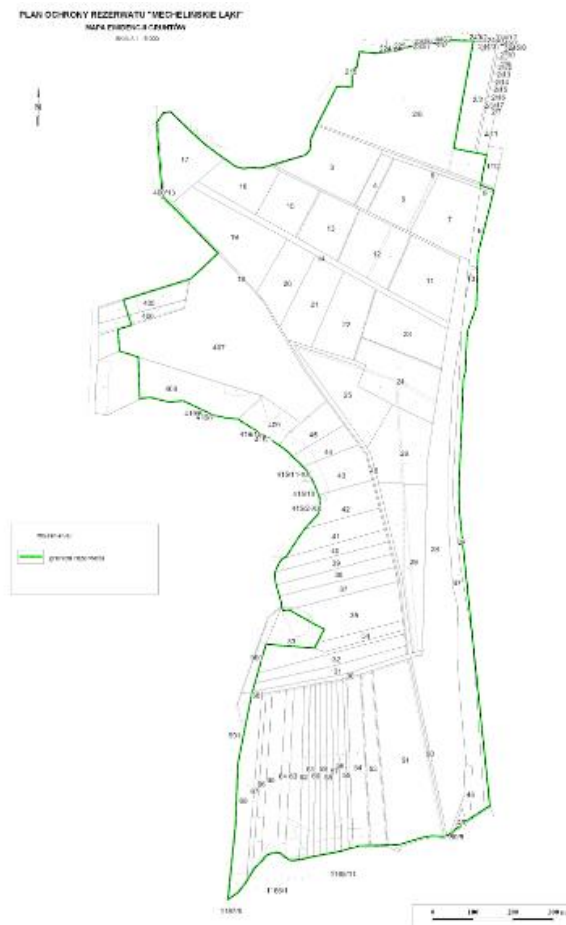
Rys. 9. Mapa ewidencyjna rezerwatu przyrody Mechelińskie Łąki.

Przedmiotowa inwestycja zlokalizowana będzie na terenie rezerwatu przyrody Mechelińskie Łąki i jego otuliny w gminie Kosakowo, powiat pucki, województwo pomorskie, działki o nr ewid. 2/6, 2/3, 18, 6, 7, 28, 11, 14, 48, 47, 69/5, 214/5. Lokalizacja wydzielonej ścieżki dydaktycznej będzie pokrywała się z obecnie wydeptanym śladem na całej długości rezerwatu i otuliny w części południowej wzdłuż wydmy, co łącznie stanowi odległość ok. 1 700 m. Dodatkowo w ramach przedsięwzięcia planuje się budowę kładki na terenie otuliny rezerwatu w części północnej, o długości całkowitej do 280 m. Kładka będzie łączyła się ze ścieżką edukacyjną na granicy rezerwatu i jego otuliny. Dodatkowym elementem inwestycji będzie wieża widokowa. Lokalizacja wieży widokowej została zaplanowana w środkowej części otuliny rezerwatu tj. na wysokości przyległej działki nr 2/16.