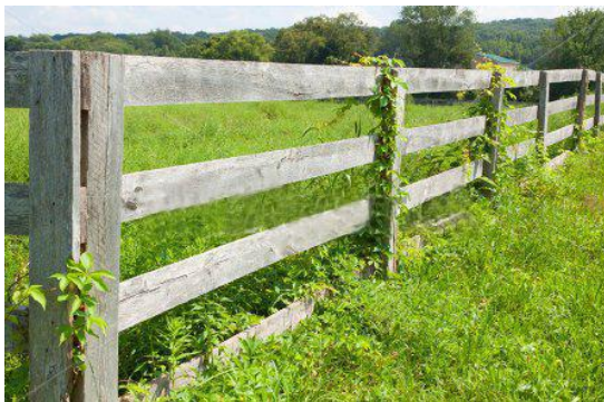
Rys.2. Przykładowa koncepcja wygradzenie ścieżki barierką drewnianą.

Przy ścieżce powinny być posadowione tablice edukacyjne dotyczące rezerwatu i w miarę możliwości, dostosowane treścią do elementów przyrody widocznych dla zwiedzających w danym miejscu. Tablica nie powinna być wyniesiona ponad barierki. Treść tablic edukacyjnych i informacyjnych powinna dotyczyć wartości przyrodniczych rezerwatu „Mechelińskie Łąki”, specyficznych procesów, które zachodzą na tym terenie (na styku lądu i morza), zasad ochrony przyrody i wynikających stąd ograniczeń oraz potrzeb ochronnych. Tablice powinny zostać opracowane przez osoby posiadające odpowiednią wiedzę w tym zakresie. Ścieżka nie będzie posiadała zejść na plażę. Ścieżka ma służyć jedynie dla ruchu pieszego.