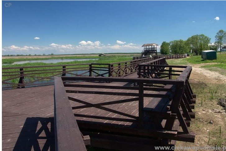
Rys.3. Przykładowa koncepcja kładki z barierką drewnianą.