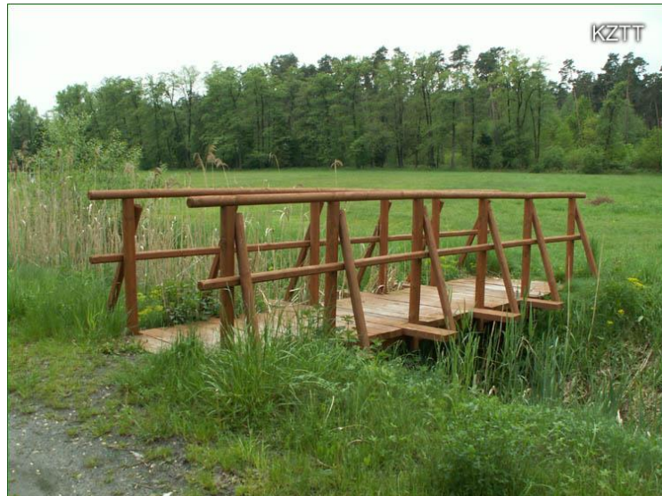
Rys.7. Przykładowa konstrukcja kładki nad rowem melioracyjnym.