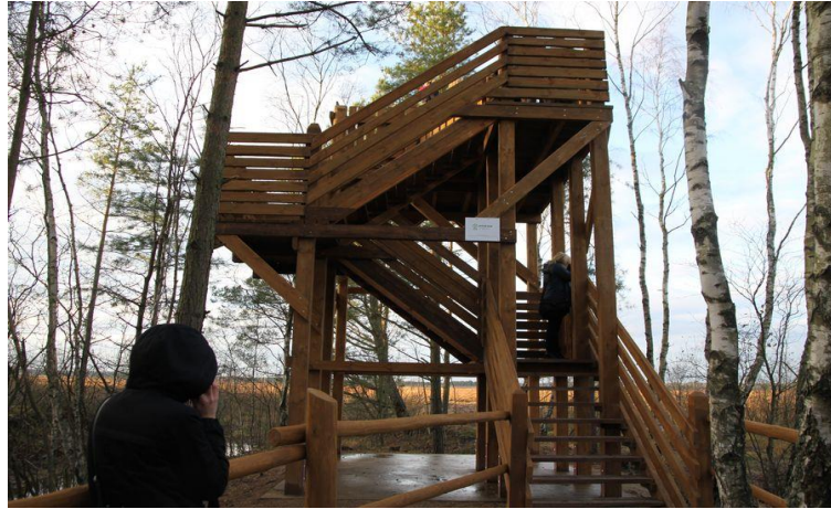
Rys. 5. Przykładowa konstrukcja wieży widokowej.